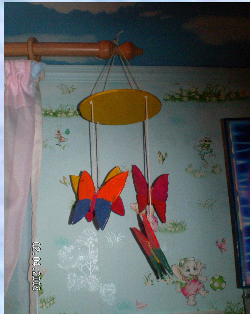
Подвеска «Летающие бабочки»