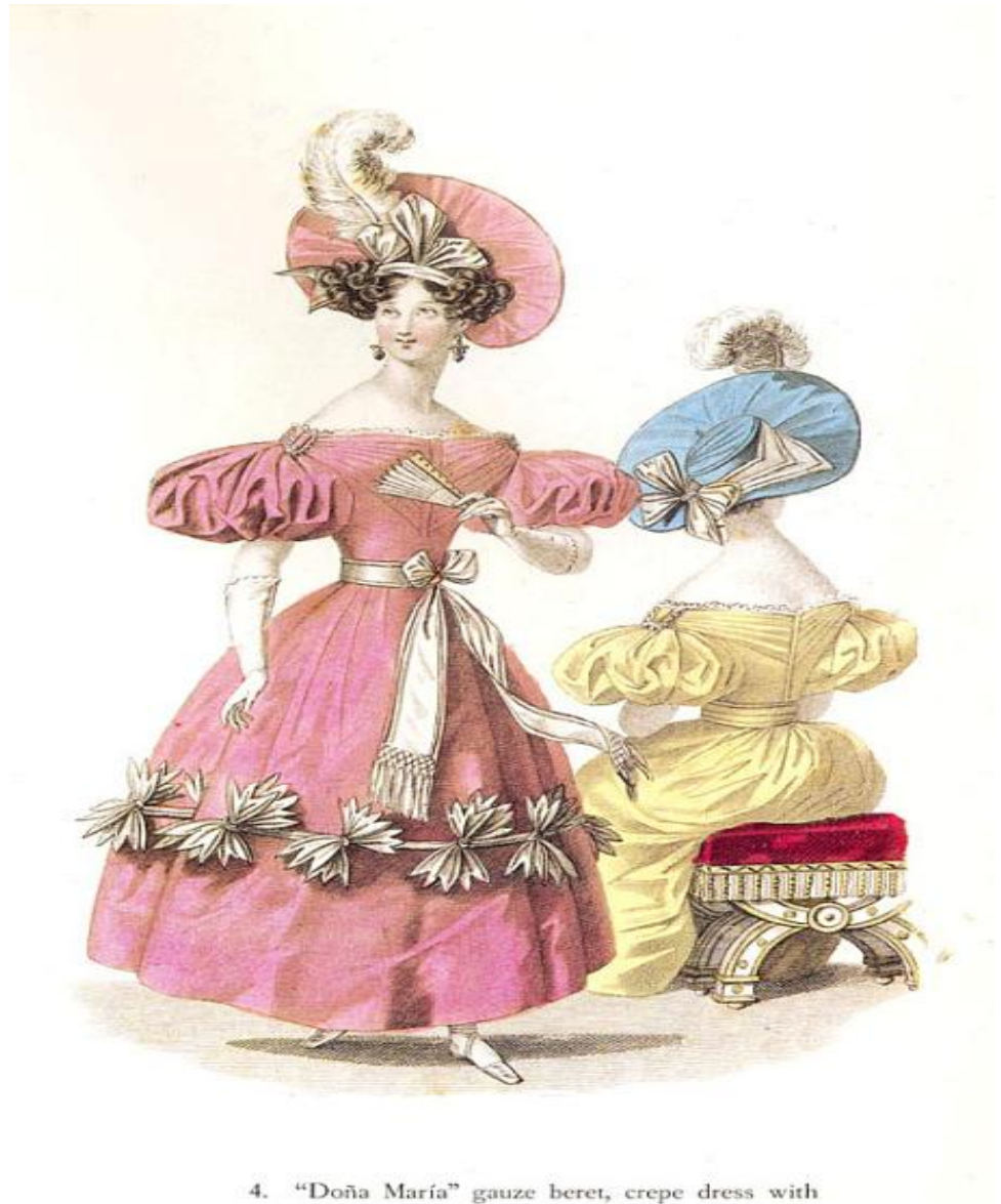
4. "Doña María" gauze beret, crepe dress with