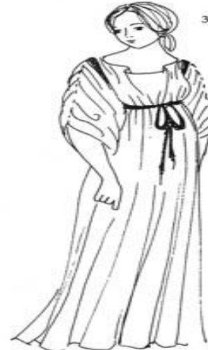
СПИНТНЫЙ ХИТОН хитон, подобный поническому, но рукава не скреплены застежками, а спинты