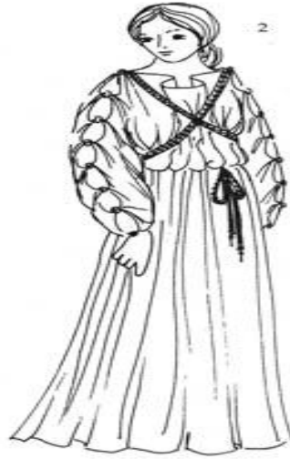
ПОНИЧЕСКИЙ ХИТОН Очень широкий хитон, скрепленный ещё и вдоль рук, формируя таким образом рукава