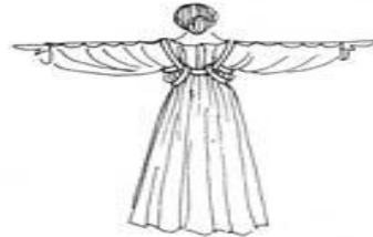
ВИД СЗАДИ Показана техника одевания хитона, изображенного на моделях 2 и 3

Перевод - Мэлфис К. (melfis_bloody@mail.ru)