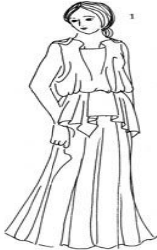
ДОРИЧЕСКИЙ ХИТОН С поясом и хорошо заметной апотигмой