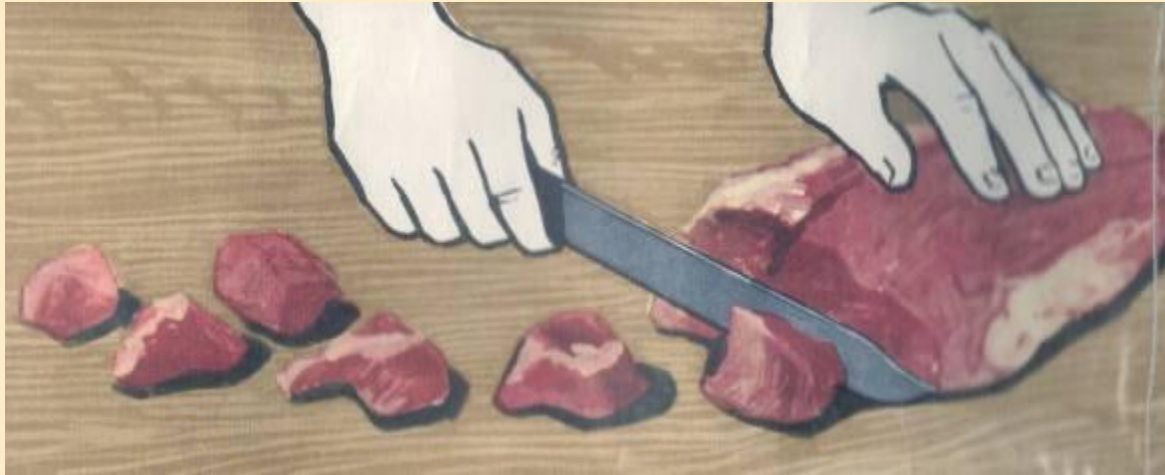
Схема приготовления мясной котлетной массы