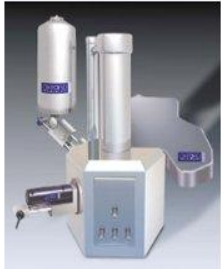
Микроанализаторы (Oxford instruments)

Рентгеновские спектрометры улавливают возникшее в образце рентгеновское излучение, а специальные приставки автоматически регистрируют интенсивность линий и все параметры процесса.