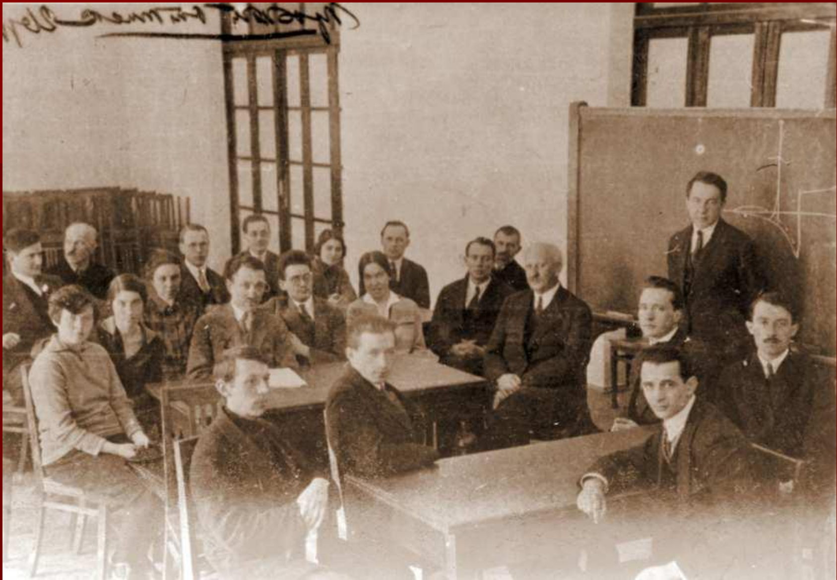
Иоффе, на семинаре по физике полупроводников. Крайний слева — И. Курчатov, рядом с Иоффе сидит Кобеко, крайний правый Г. Гринберг, у доски — Цехновицер.