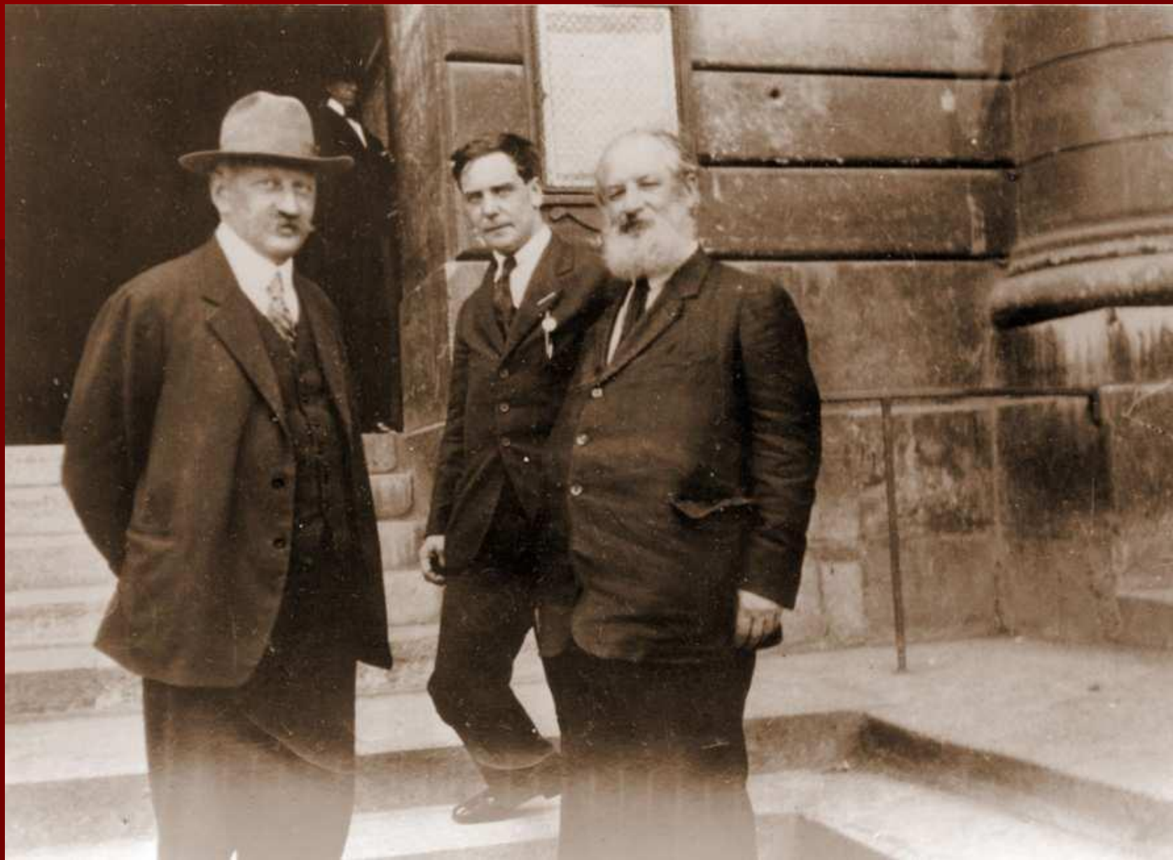
Иоффе, Капица, Крылов. Лейден, 1924