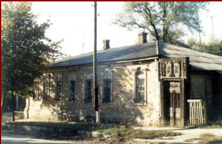
Дом семьи Иоффе в г. Ромны.