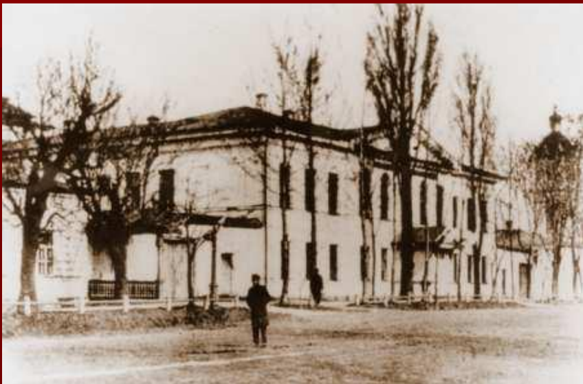
Роменское реальное училище.