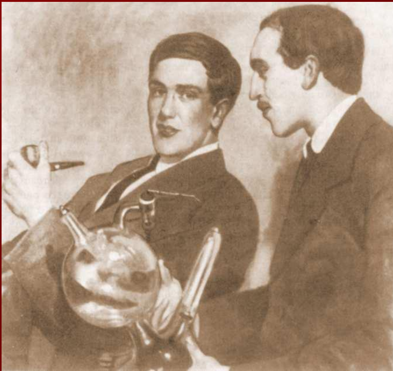
Б.М. Кустодиев. Портрет П.Л. Капицы и Н.Н. Семенова. Х., м. 71 x 71. 1921 г.