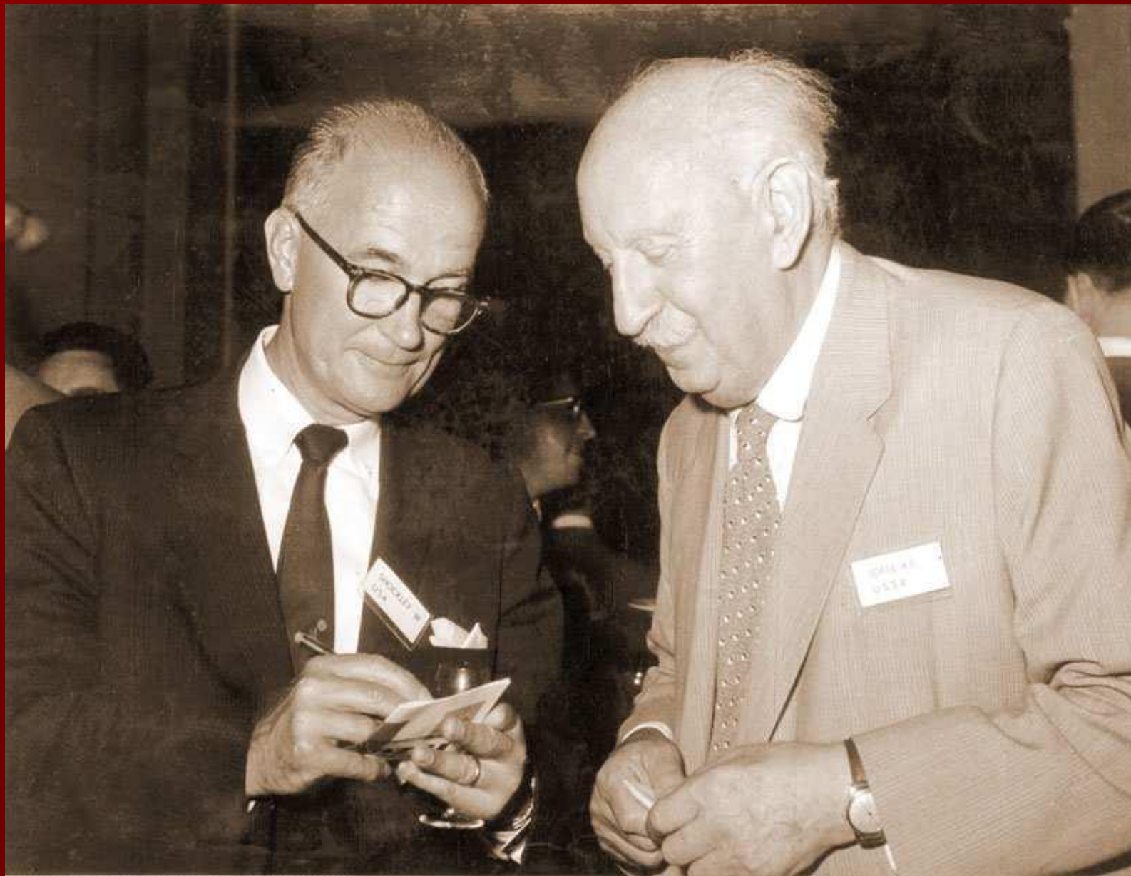
В. Шокли и Иоффе. Прага. 1960.