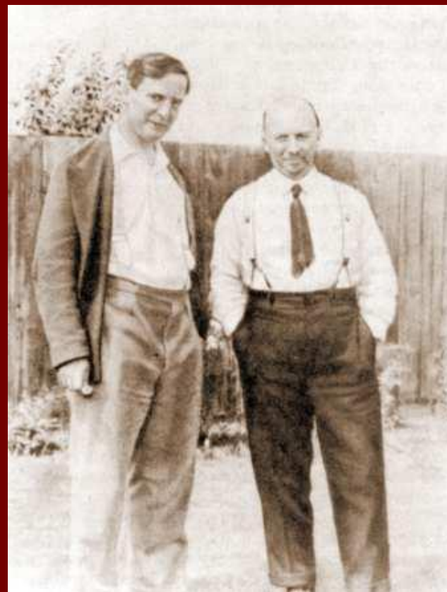
П.Л. Капица и Н.И. Бухарин во дворе кембриджского дома Капицы. Июль 1931 г.