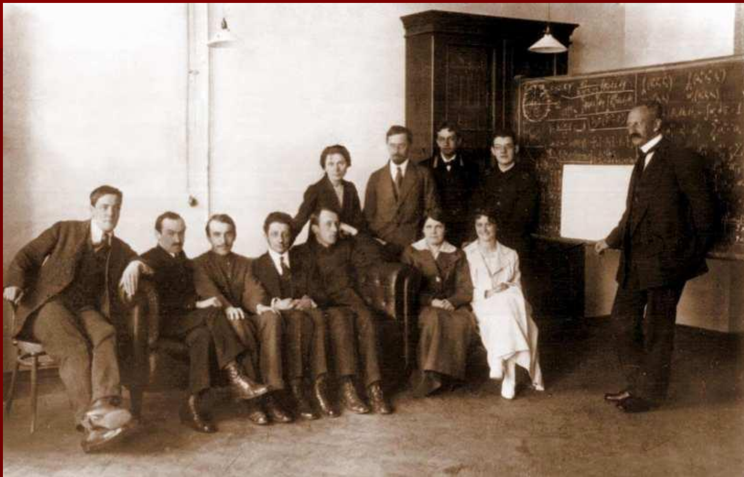
Семинар Иоффе в Политехническом институте. 1916 г.