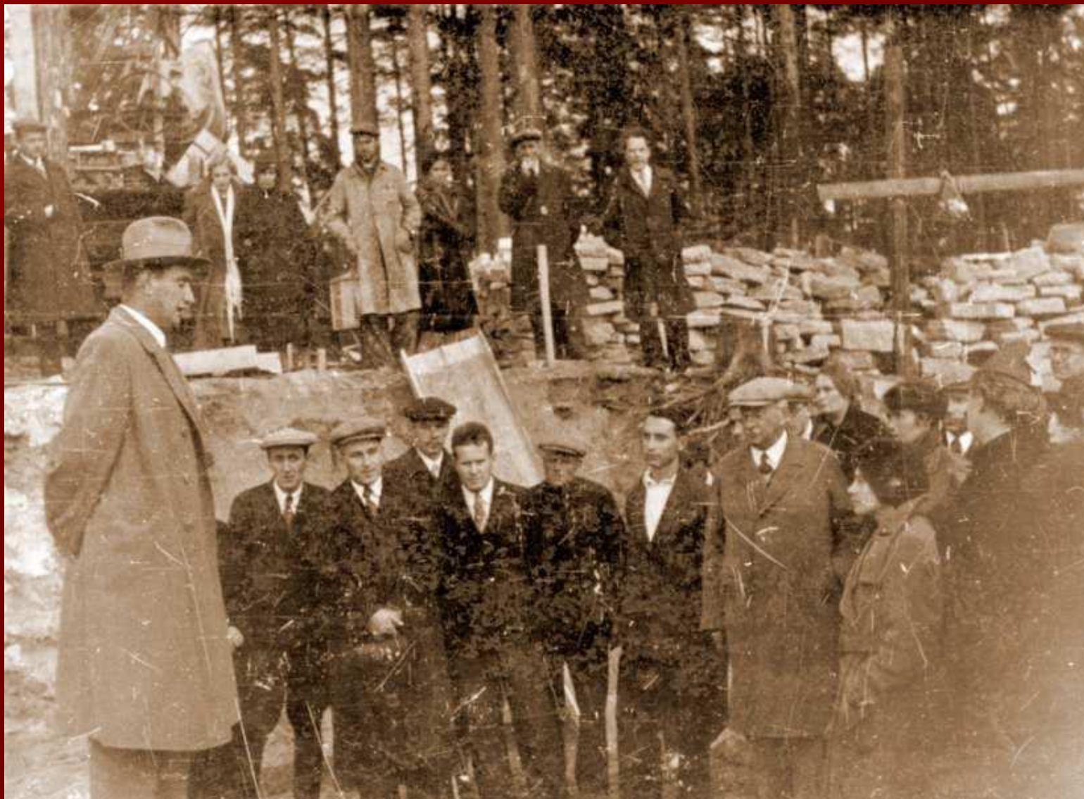
Иоффе на строительстве циклотрона ФТИ. Крайний слева на переднем плане — Курчатов.