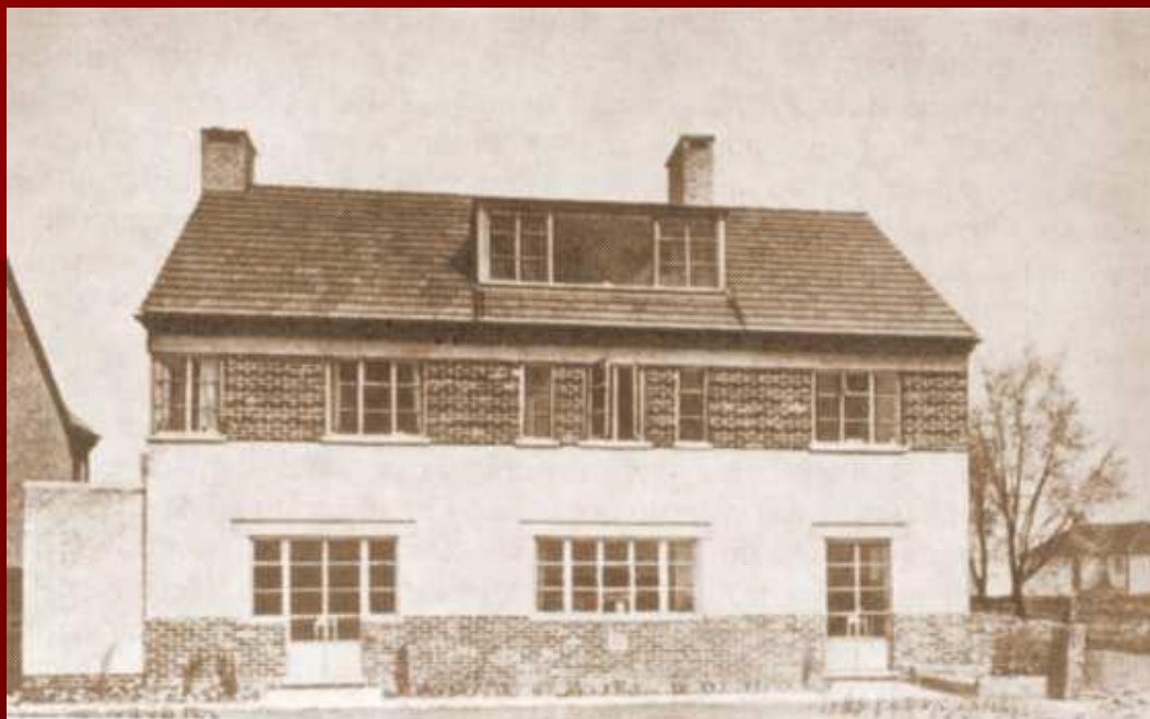
Дом П.Л. Капицы в Кембридже. В 1970 г. он был подарен им Академии наук СССР