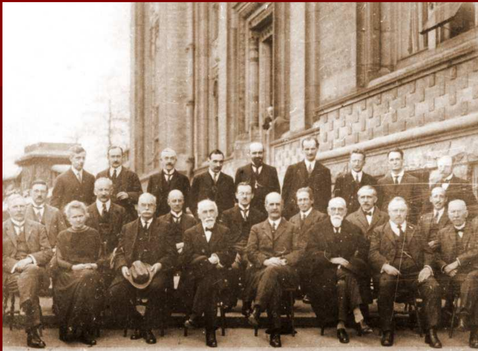
Иоффе на Сольвеевском конгрессе. 1924 г