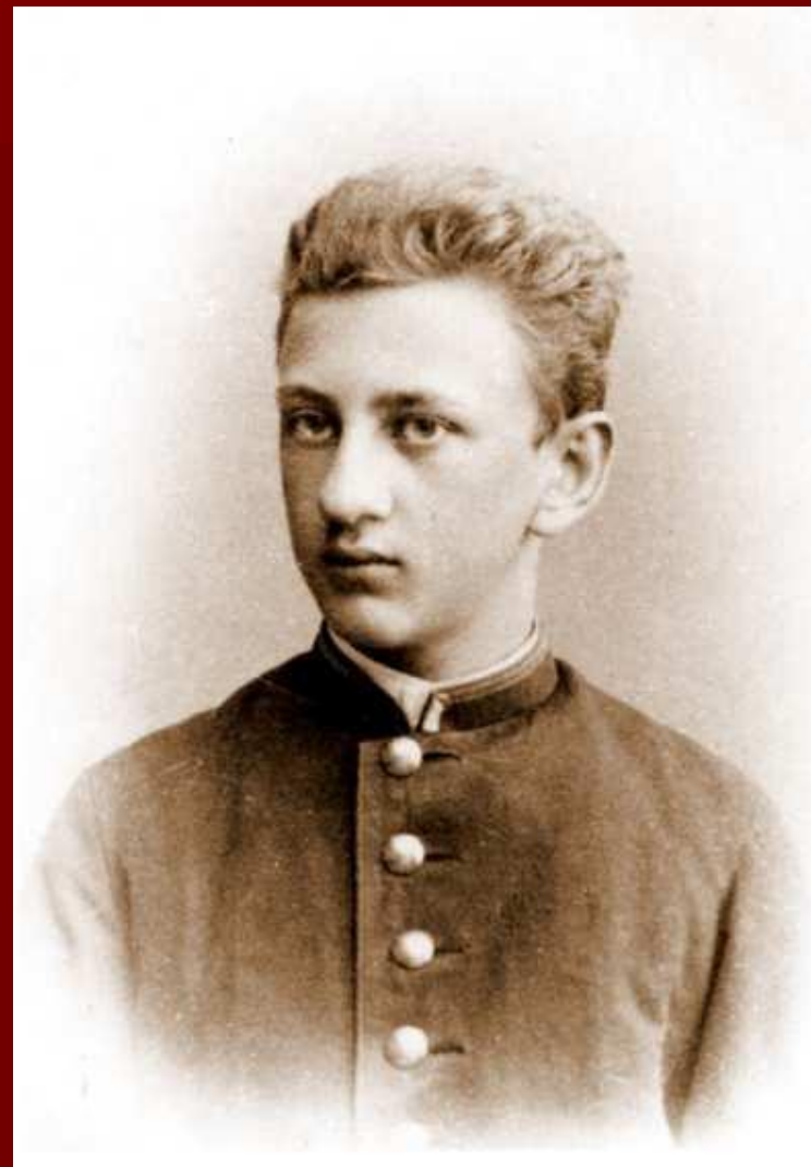
Выпускник реального училища. 1897 г.