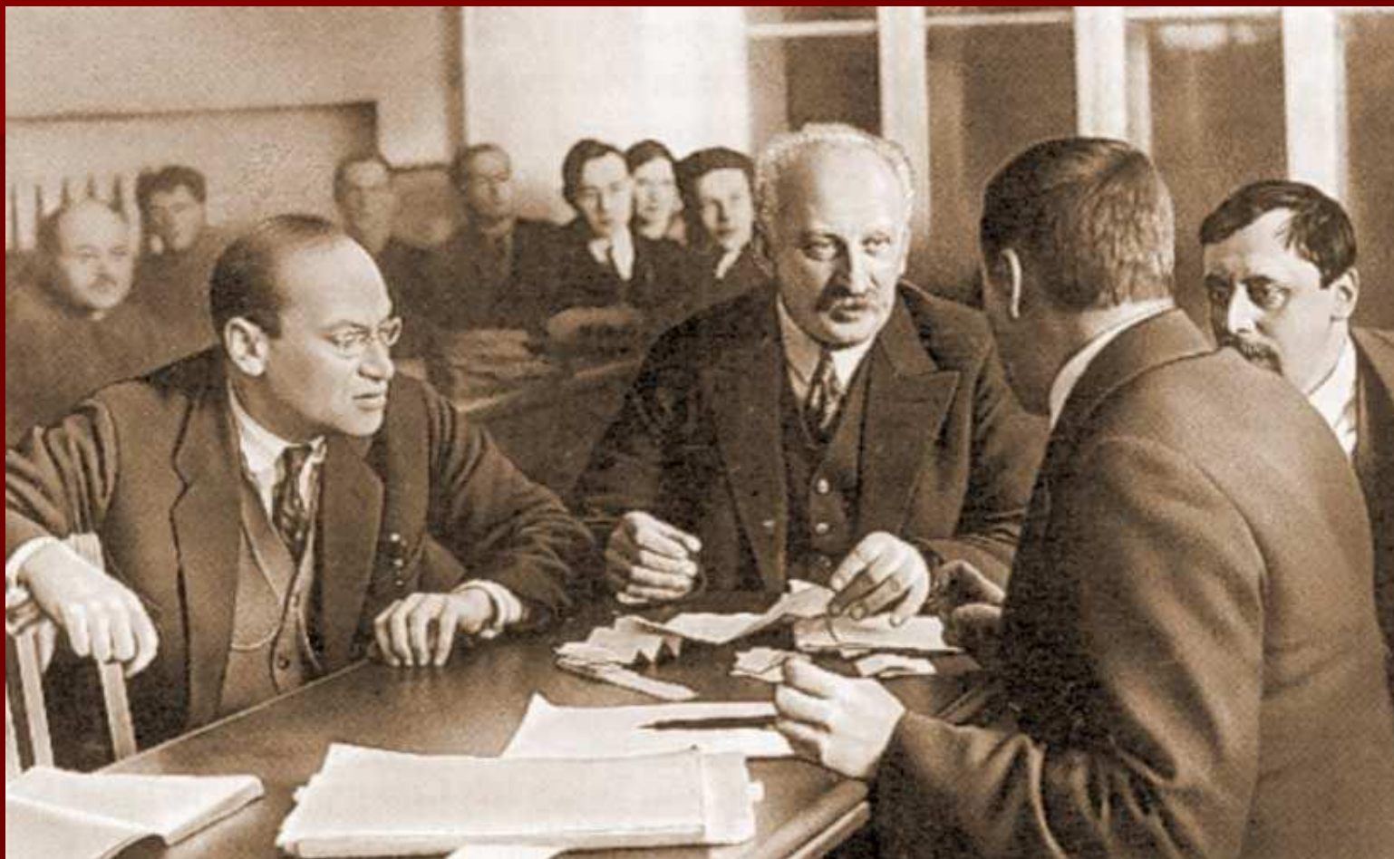
Заседание Ученого совета ФТИ. Френкель, Иоффе, Бурсиан (спиной) — ученый секретарь, Добронравов. Конец 20-х гг.