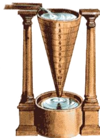
клепсидра – водяные часы