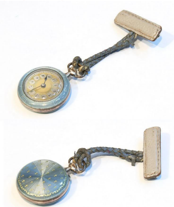
Дамские карманные часы

Сначала наручные часы носились только женщинами, но во время Первой Мировой Войны мужчины также начали носить наручные часы, которые стали более распространенными, чем карманные часы. Говорят, что во время войны солдаты нашли наручные часы более подходящими, чем карманные часы.