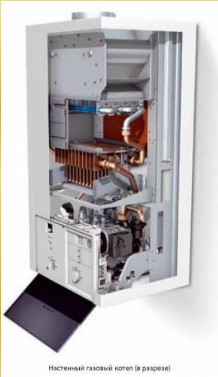
Настенный газовый котел (в разрезе)

Существенно повышается энергетическая эффективность системы теплоснабжения (оценивается только КПД котла 92-96%) и исключается полностью трубопроводная сеть при применении в экономически оправданных случаях поквартирного теплоснабжения на основе двухконтурных настенных газовых котлов с закрытой топкой. Такие котлы характеризуются малым удельным весом до 0,5 кг/кВт мощности, бесшумностью низкой эмиссией и не оказывают влияние на воздушный баланс в жилых помещениях. Но, к сожалению, в России серийное производство таких котлов еще не освоено.