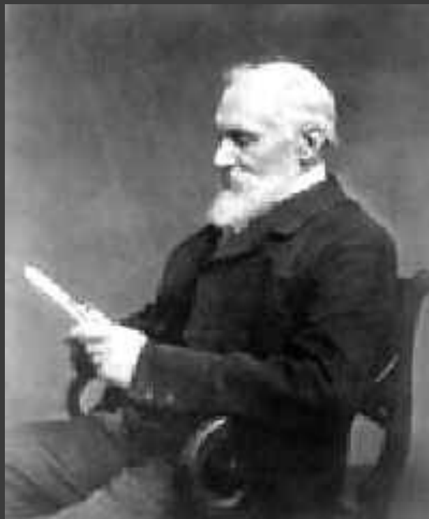
Лорд кельвин в конце жизни

Лорд Кельвин умер 17 декабря 1907 г. и по достоинству покоится в Вестминстерском аббатстве рядом с сэром Исааком Ньютоном.