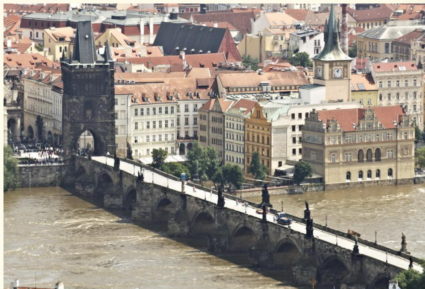
Фото сделано мною еще в июне во время наводнения (вода в реке бурная и грязная)

Дальше наш путь лежал мимо знаменитой пивнушки «У Бегемота», где нам не хватило места, к центральной достопримечательности города Карлову Мосту.