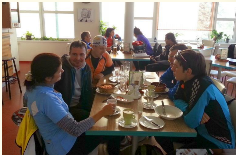
Фото официантки не сохранилось, но точка на карте, где находится это кафе, стоит!!!

Точнее у официантки было такО- О-Ое декольте, что у мужской половины группы усталость сразу как рукой сняло, и пещеры были забыты в тот же миг 😊