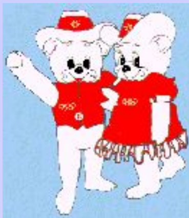
Хайди и Хоуди