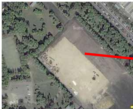
Зона спортивной активности