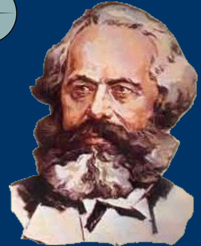
К. Маркс. «К критике политической экономики».

На известной ступени своего развития материальные производительные силы общества приходят в противоречие с существующими производственными отношениями, или — что является только юридическим выражением последних — с отношениями собственности, внутри которых они до сих пор развивались. Из форм развития производительных сил эти отношения превращаются в их оковы. Тогда наступает эпоха социальной революции. С изменением экономической основы более или менее быстро происходит переворот во всей громадной надстройке.