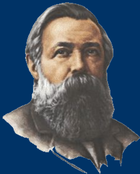
Ф. Энгельс. «Людвиг Фейербах и конец классической немецкой философии».

Первый толчок дала книга Штрауса «Жизнь Иисуса», вышедшая в 1835 году. Против изложенной в этой книге теории возникновение эвангельских мифов выступил позднее Bruno Bauer, доказывавший, что целью ряд эвангельских рассказов сфабрикован самими авторами евангелий. Спор между Штраусом и Бауэром велся под видом философской борьбы между «самосознанием» и «субстанцией». Вопрос о том, возникли ли эвангельские рассказы о чудесах путём бесознательного, основанного на традиции, создания мифов в недрах общины или же они были сфабрикованы самими евангелистами, — разросся до вопроса о том, что является главной действительной силой во всемирной истории: «субстанция» или «самосознание».