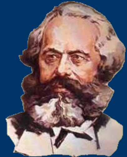
К. Маркс. «Восемнадцатое брюмера Луи Бонапарта».

Люди сами делают свою историю, но они её делают не так, как им вздумается, при обстоятельствах, которые не сами они выбрали, а которые непосредственно имеются налицо, даны им и перешли от прошлого.