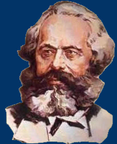
К. Маркс. «К критике политической экономики».

В общественном производстве своей жизни люди вступают в определённые, необходимые, от их воли не зависящие отношения – производственные отношения, которые соответствуют определённой ступени развития их материальных производительных сил. Совокупность этих производственных отношений составляет экономическую структуру общества, реальный базис, на котором возвышается юридическая и политическая надстройка и которому соответствуют определённые формы общественного сознания.