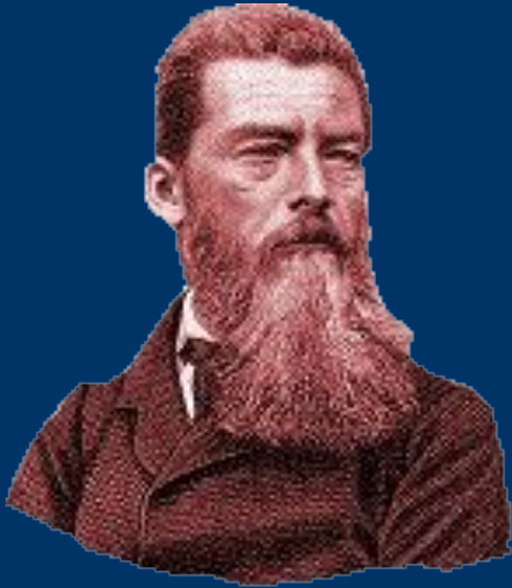
Л. Фейербах. «Сущность христианства».

... понятие божества совпадает с понятием человечества. Все божественные определения, все определения делающие Бога богом, суть определения рода – определения, ограниченные отдельным существом, индивидуумом и не ограниченные в сущности рода и даже в его существовании, поскольку это существование соответственно проявляется только во всех людях, взятых как нечто собирательное. <...> Бог есть понятие рода как индивида , понятие или сущность рода; он как всеобщая сущность, как средоточие всех совершенств, всех качеств, свободных от действительных или мнимых границ индивидуа, есть в то же время существо отдельное, индивидуальное .