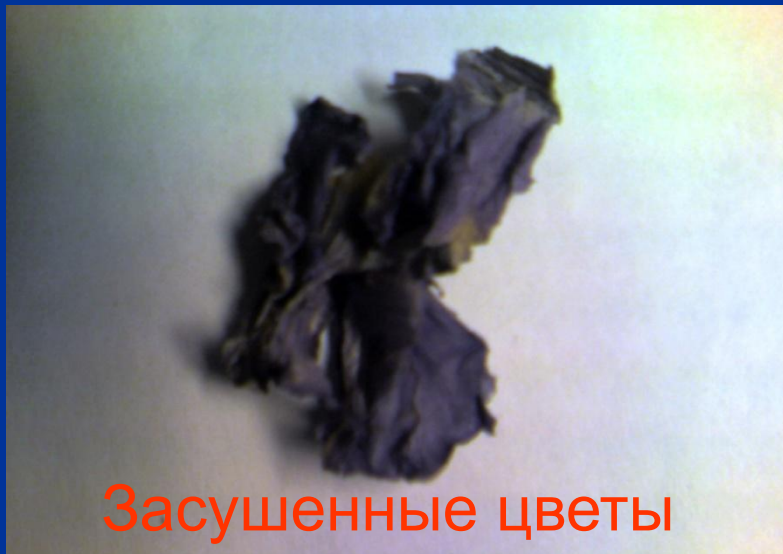
Засушенные цветы фиалки