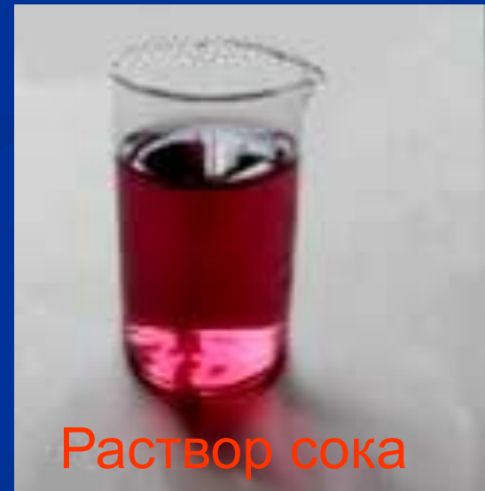
Раствор сока черноплодной рябины