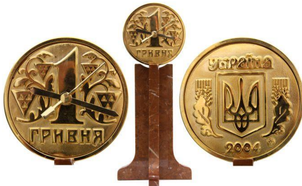
«1 гривня», действующие часы, медь - гальванопластика с позолотой, (президенту Национального Банка Украины и директору Банкіотно-монетного Двора Украины)