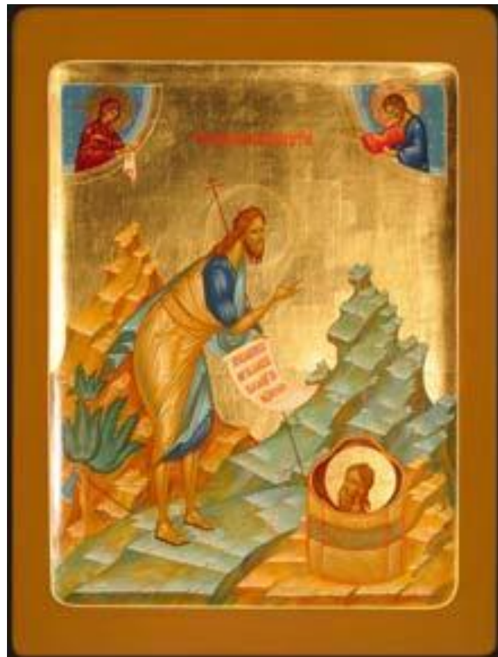
Икона «Иоанн Предтеча», современный мастер