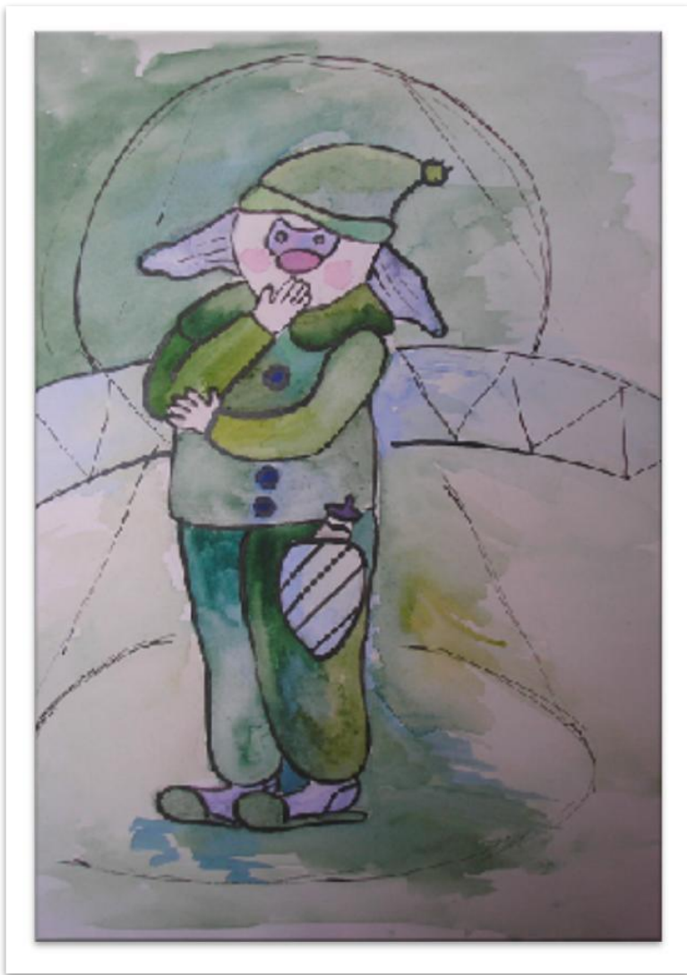
Буянкина Екатерина Грустный клоун 2008, акварель