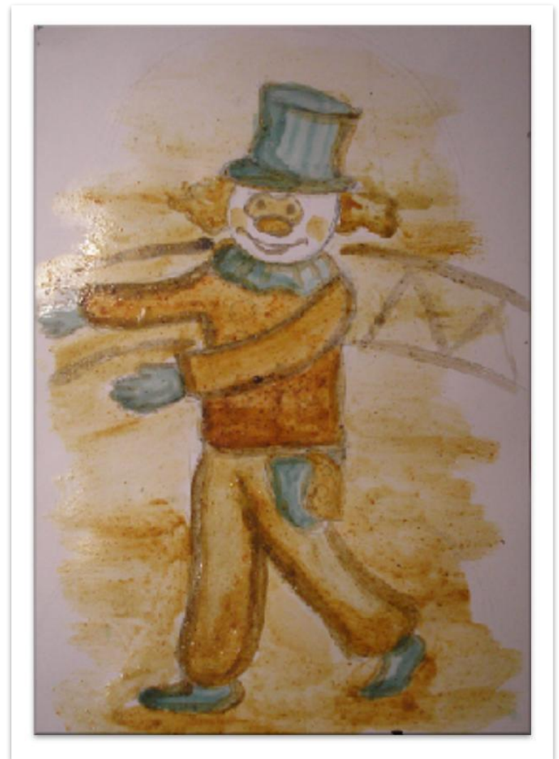
Буянкина Екатерина Веселый клоун 2008, яичная темпера