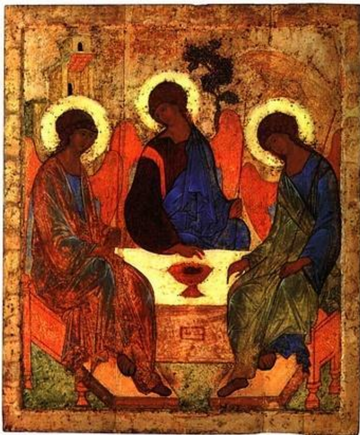
Андрей Рублев. «Троица». 1420-е годы