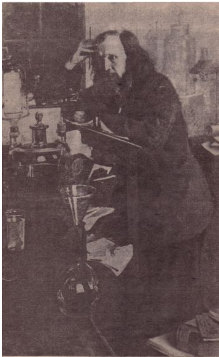
Д. И. Менделеев за конторкой. Портрет работы художника Н. А. Ярошенко.