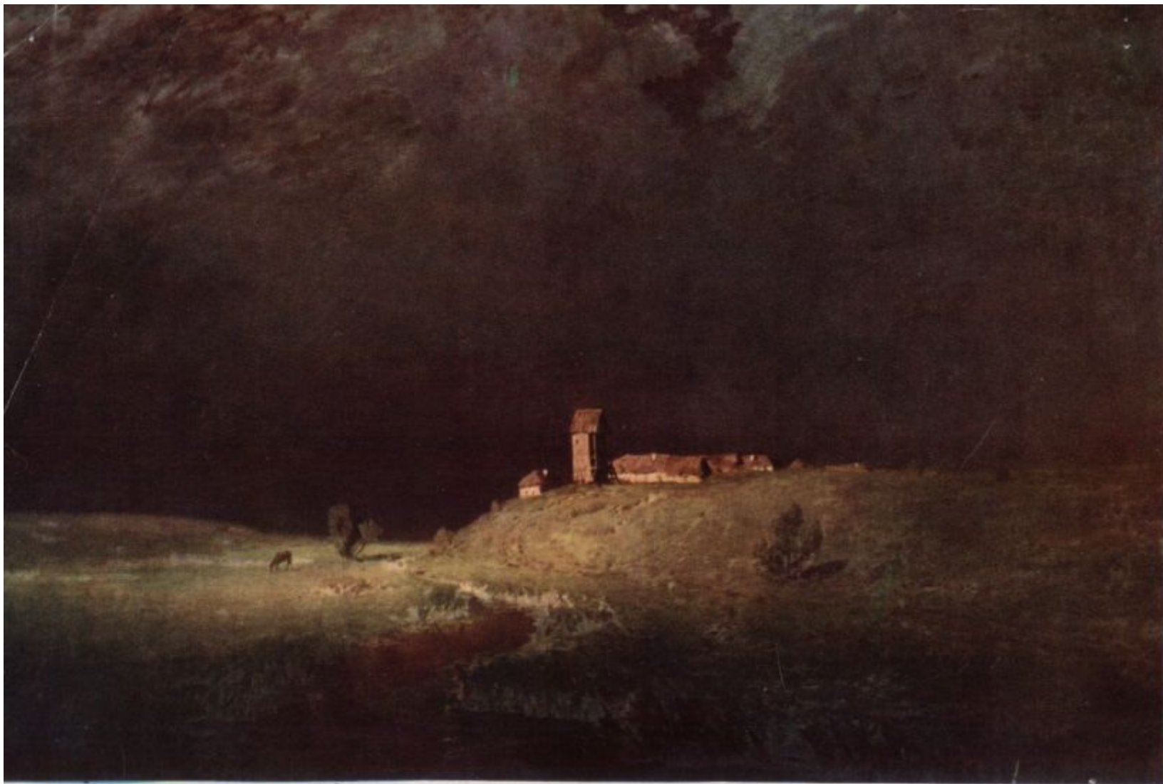
А. Куинджи. 1842—1910. ПОСЛЕ ГРОЗЫ. 1879.