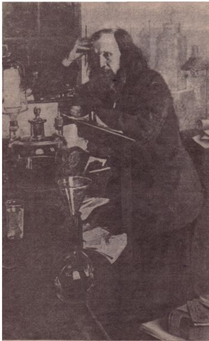
Д. И. Менделеев за конторкой. Портрет работы художника Н. А. Ярошенко.