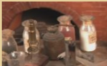
Микроскоп. Перегонный куб