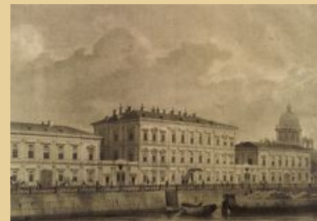
Дом М.В. Ломоносова на Мойке.