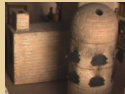
Печь для варки стекла

«Мы озаботились устроить их, — писал М. В. Ломоносов, — ввиду многообразного ежедневного их употребления: ведь все химические операции, производящиеся огнем, можно в них осуществлять надлежащим образом, если потребует необходимость».