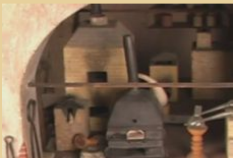
Плавильная печь, пробирная, перегонная

«Мы озаботились устроить их, — писал М. В. Ломоносов, — ввиду многообразного ежедневного их употребления: ведь все химические операции, производящиеся огнем, можно в них осуществлять надлежащим образом, если потребует необходимость».