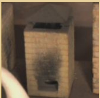
Печь с сильным дутьем