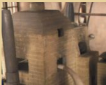
Печь для финифти