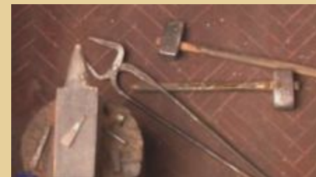
Топор, щипцы, ножницы большие крепкие, наковальня, молотки и кузнечные молоты

Кроме печей различной конструкции и назначения, лаборатория была оснащена химической посудой, различным оборудованием и приборами. В связи с необходимостью проводить исследование руд и других природных материалов М.В. Ломоносов уделил большое внимание оборудованию для пробирного анализа..