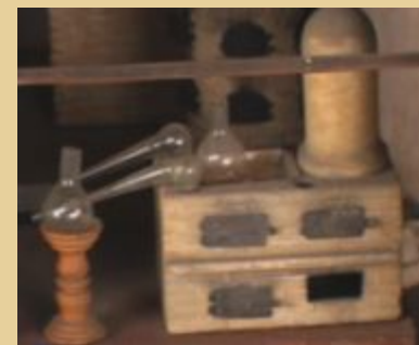
«Атакор» для выпаривания и перегонки