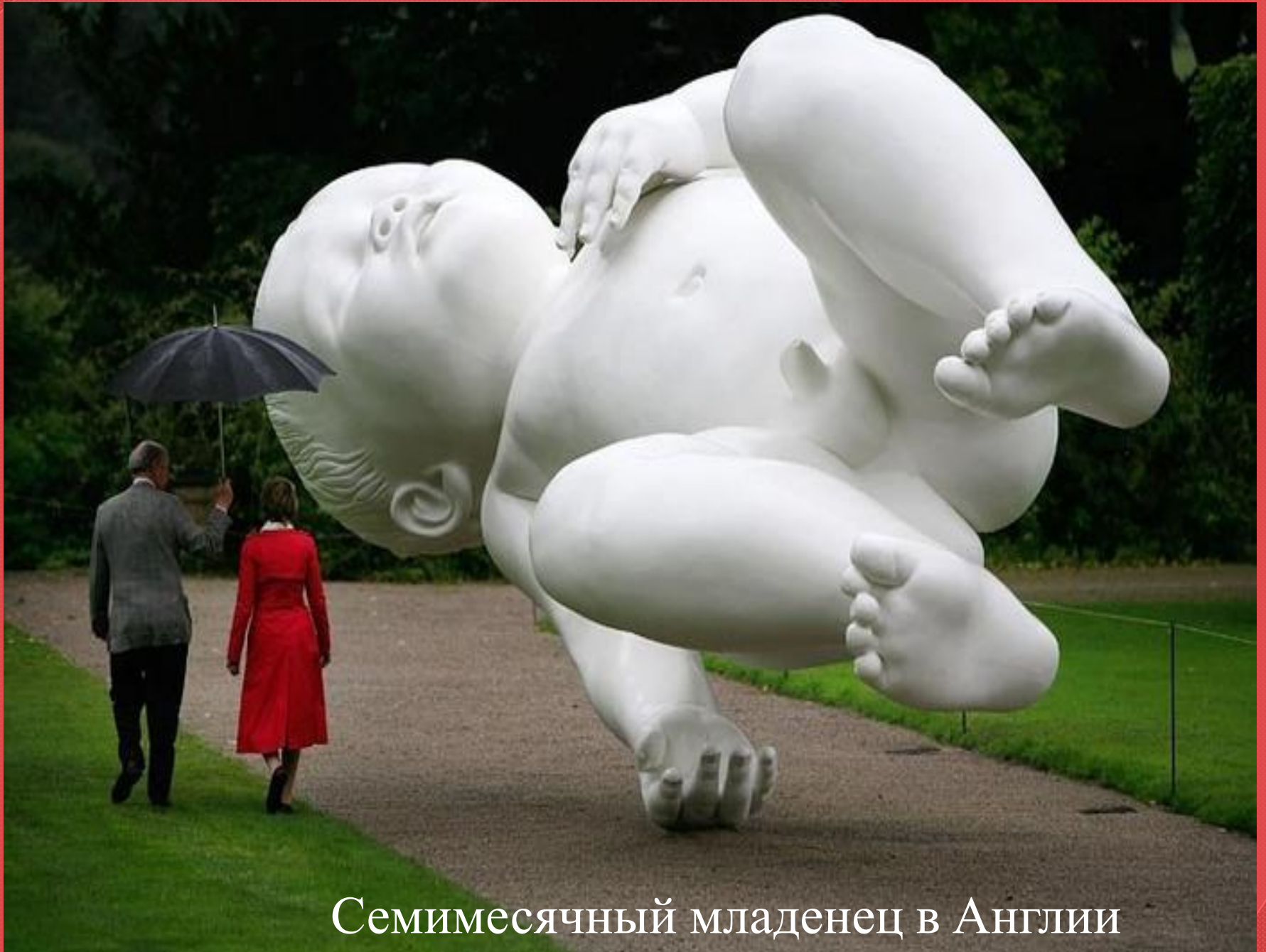
Семимесячный младенец в Англии