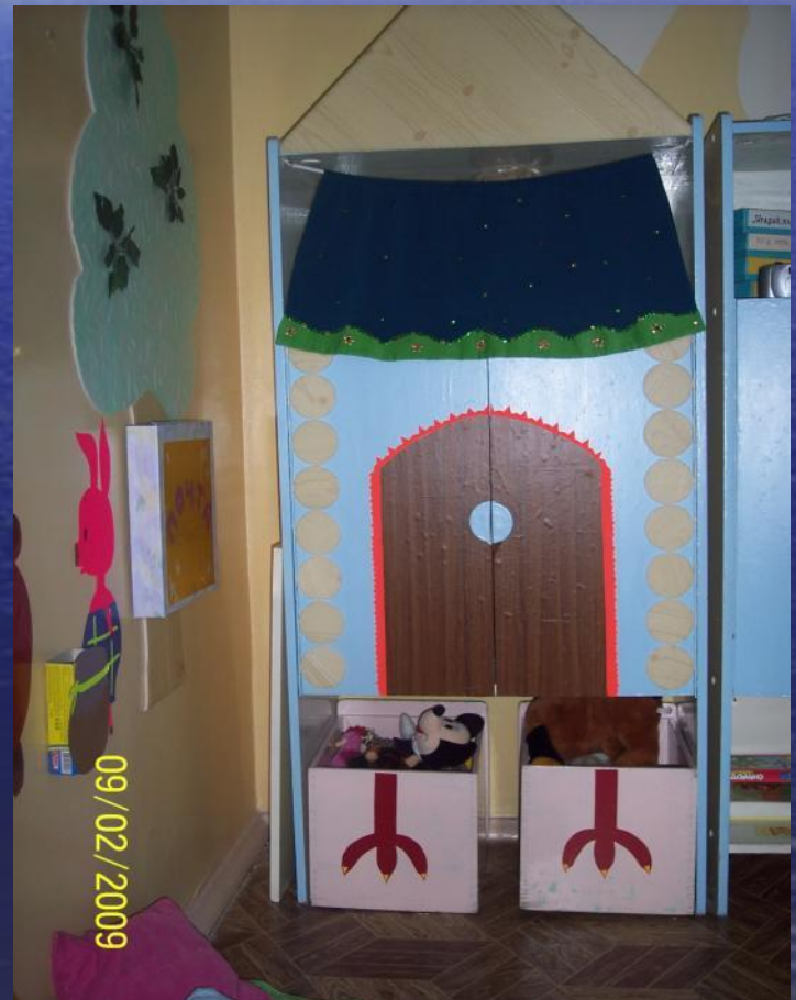
Избушка Трёх медведей