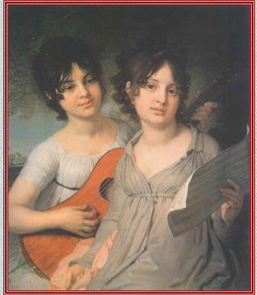
Портрет сестер Гагариных