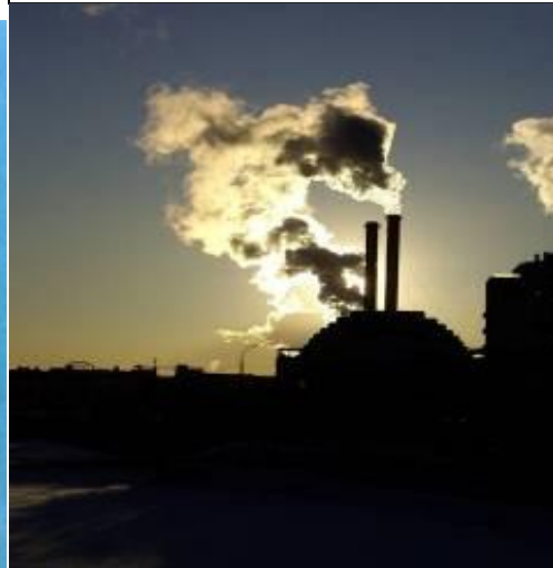
die Fabrik (-en)