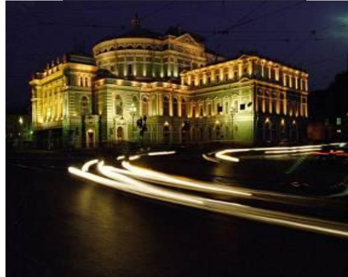
das Theater (=)