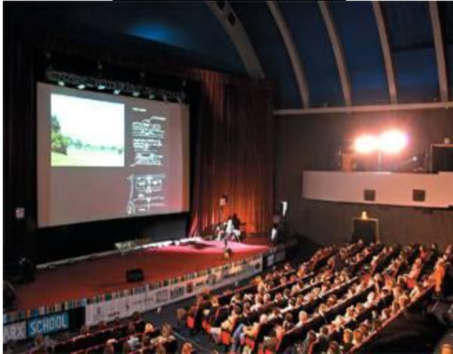
das Kino (-s)