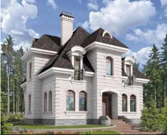
das kommunale Haus