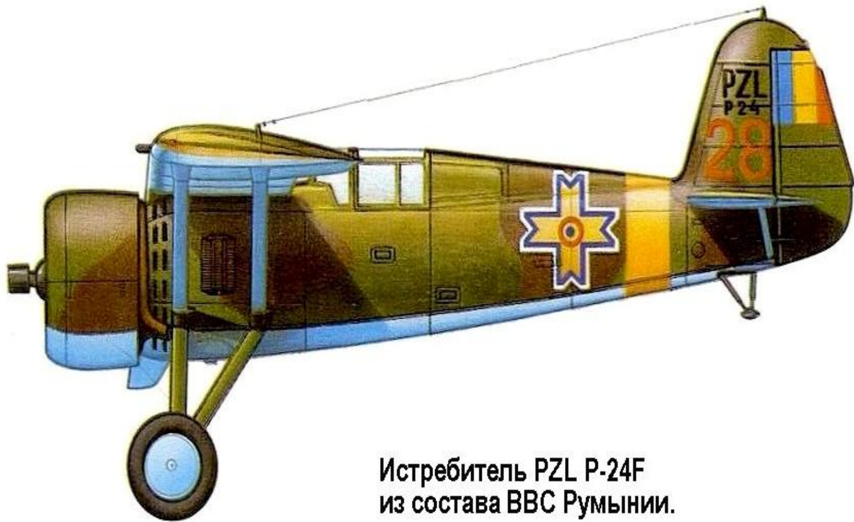
Истребитель PZL P-24F из состава ВВС Румынии.