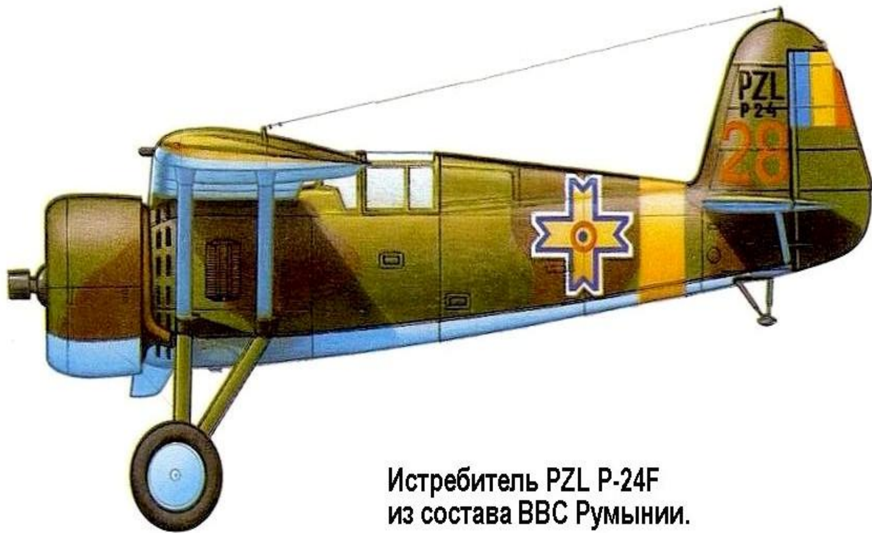
Истребитель PZL P-24F из состава ВВС Румынии.