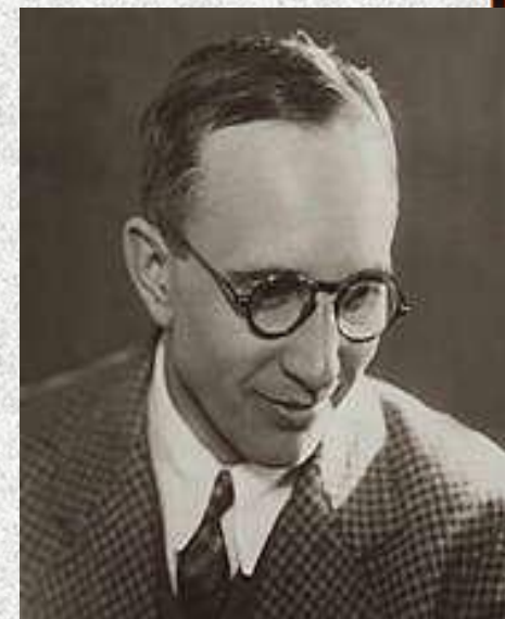
Лапин Б. (1905 – 1941 г.г.)