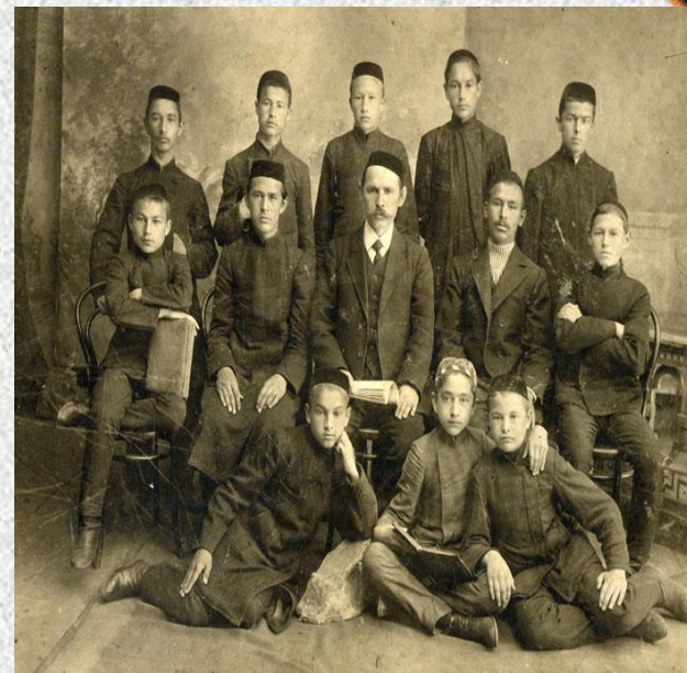
Учёба в медресе