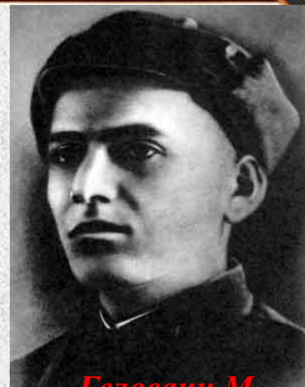
Геловани М. (1917 – 1944 г.г.)