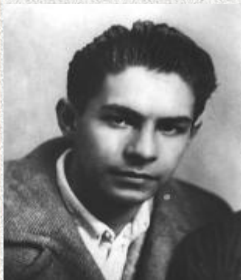
Багрицкий В. (1922 – 1942 г.г.)