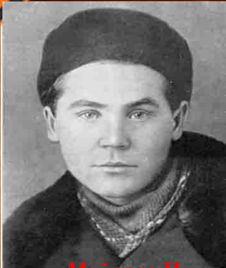
Майоров Н. (1919 – 1942 г.г.)