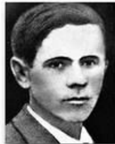
Сурначев М. (1917 – 1945 г.г.)