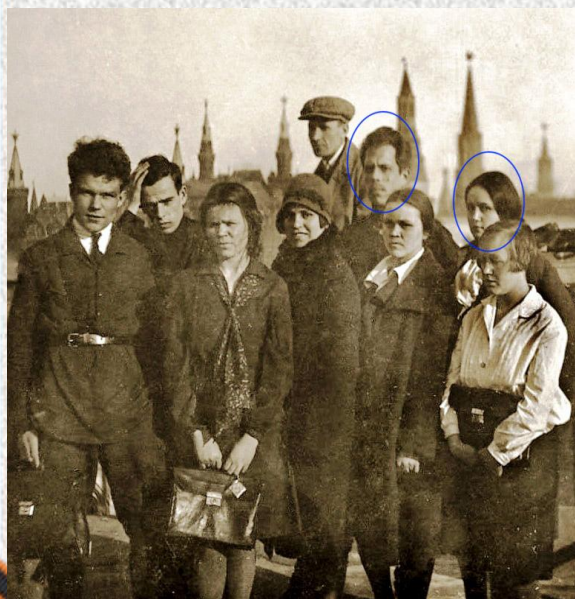
Учёба в МГУ