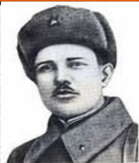
Суворов Г. (1919 – 1944 г.г.)