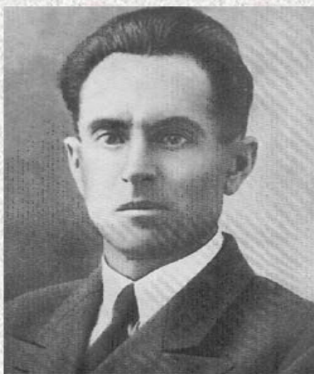
Шогенцуков А. (1900 – 1941 г.г.)