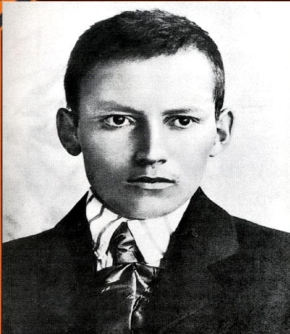
Джалиль Муса (1906-1944 г.г.)