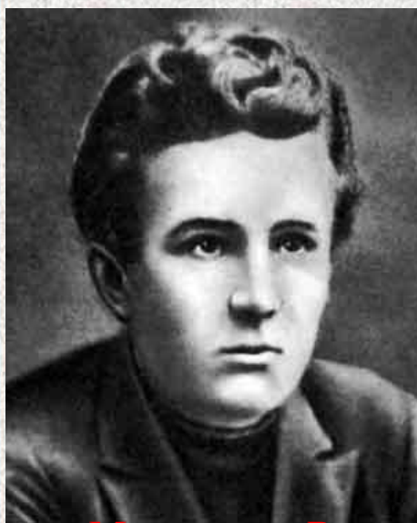
Монтвила В. (1902 – 1941 г.г.)