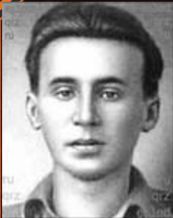
Павел Коган (1918-1942 г.г.)