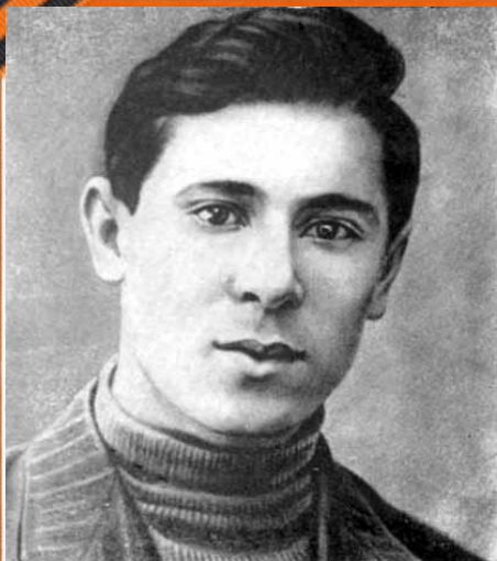
Джалиль М. (1906 – 1944 г.г.)