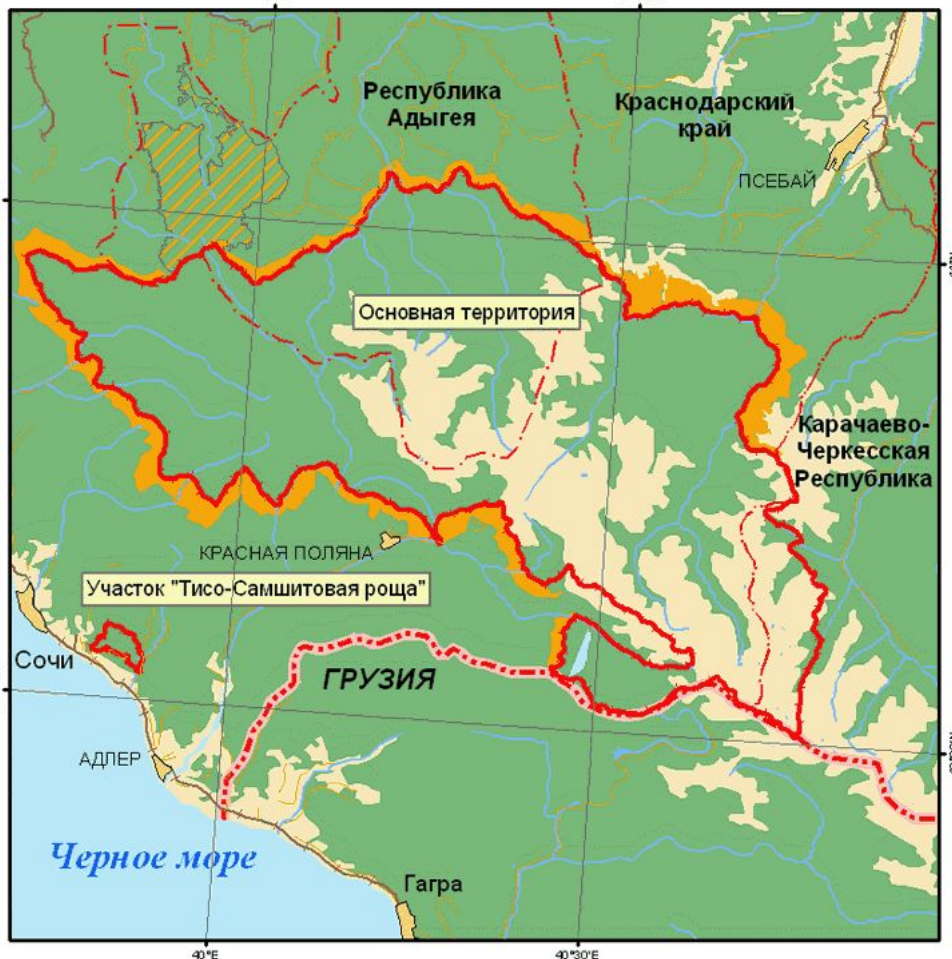
Кавказский биосферный резерват

Дата создания КГПБЗ является право- преемником Кавказского зубрового заповедника, учрежденного 12 мая 1924 года Декретом СНК СССР. Площадь запове- дника неоднократно изме- нялась ( в настоящее время составляет 280 335 га). Ряд участков в 50- х-60-х годах прошлого века изымался и передавался для лесопользования, скотоводства и туризма.