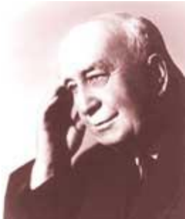
В. Н. Сукачев (1880—1967). Автор термина биогеоценоз

Экосистема является открытой системой и характеризуется входными и выходными потоками вещества и энергии . Основа существования практически любой экосистемы — поток энергии солнечного света, который является следствием термоядерной реакции, — в прямом (фотосинтез) или косвенном (разложение органического вещества) виде, за исключением глубоководных экосистем: « чёрных » и « белых » курильщиков, источником энергии в которых является внутреннее тепло земли и энергия химических реакций.