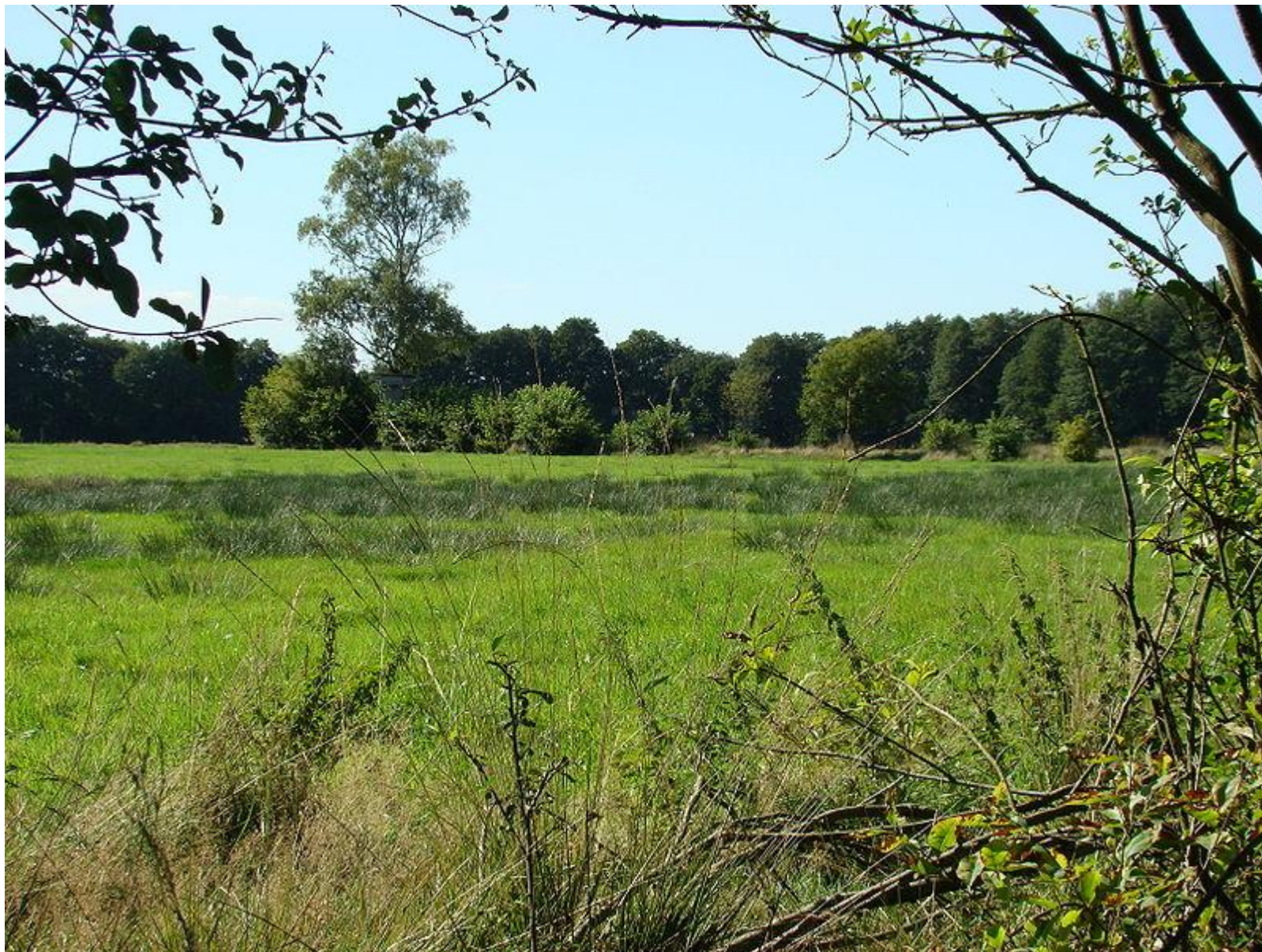
Пример стадии гетеротрофной сукцессии — заболоченный луг