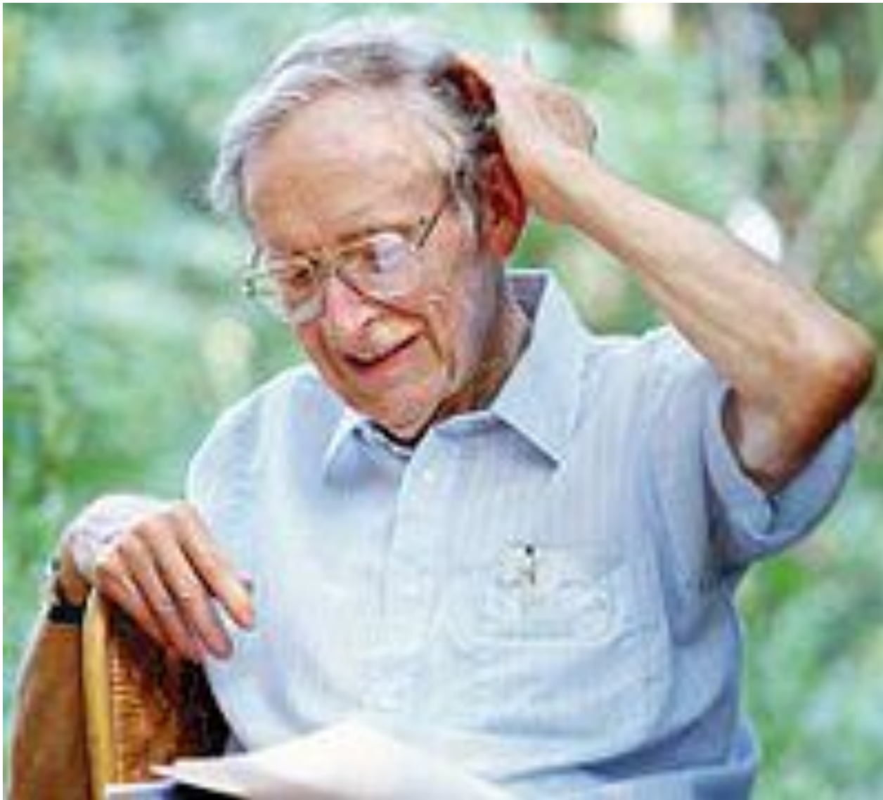
Юджин Одум (1913–2000). Отец экосистемной экологии