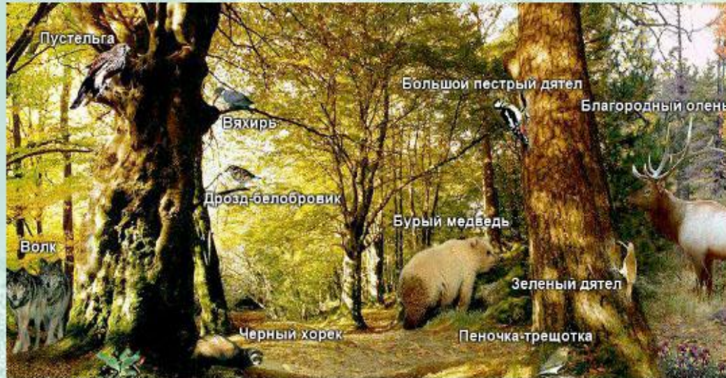
Экосистема - широколиственный лес.