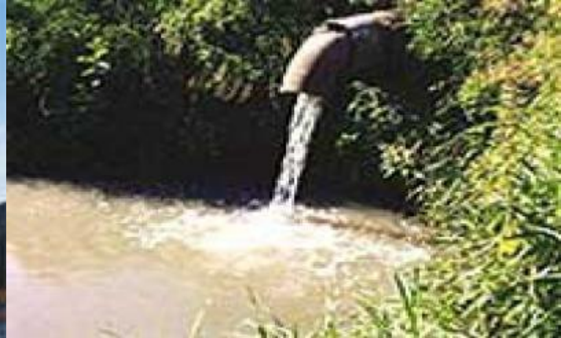
Сток промышленных отходов