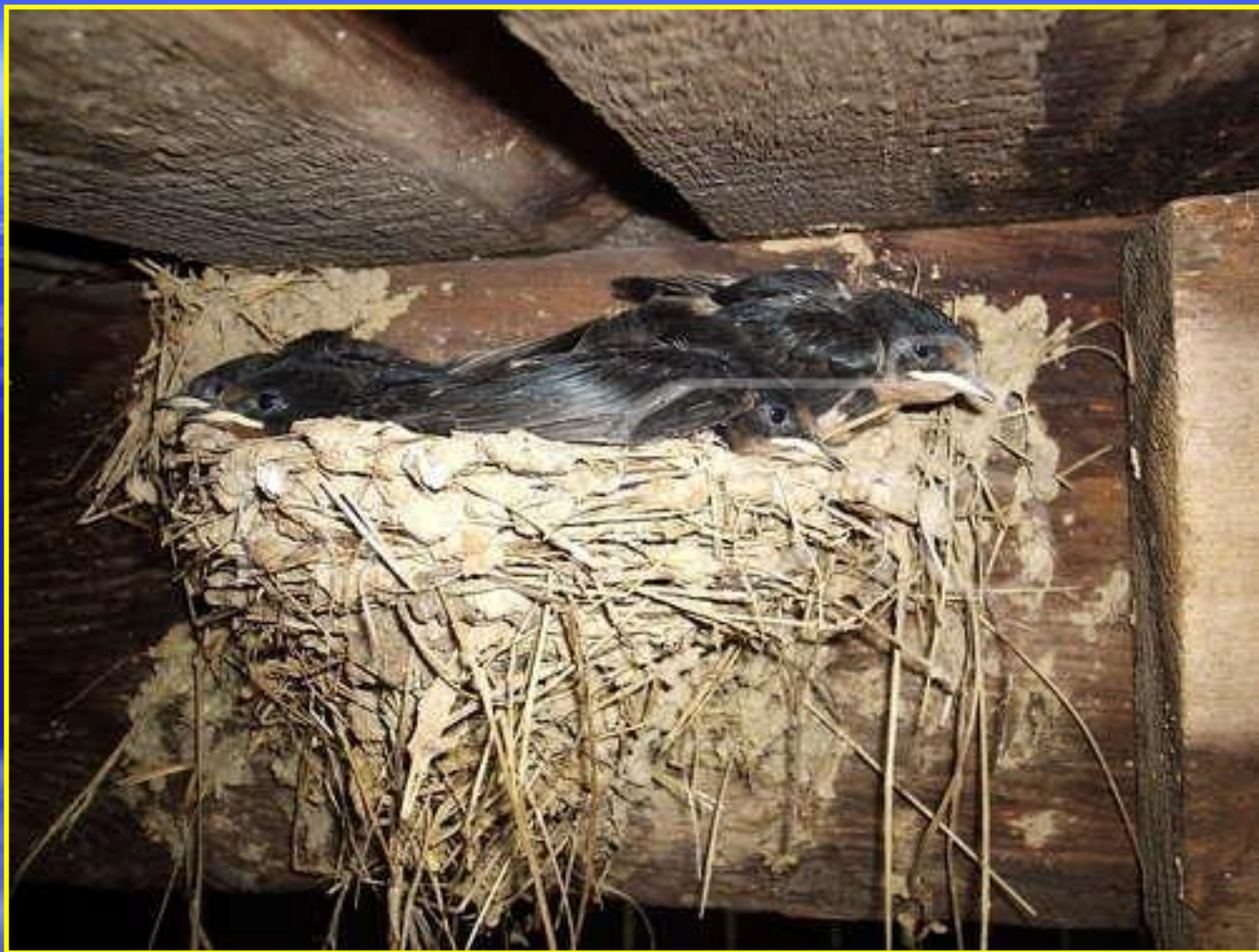
Рис. 6 Гнездо ласточки