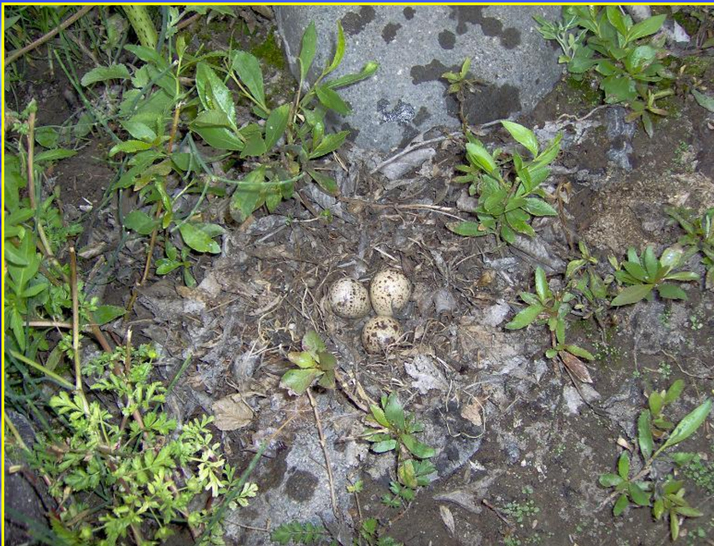
Рис. 8 Гнездо чибиса