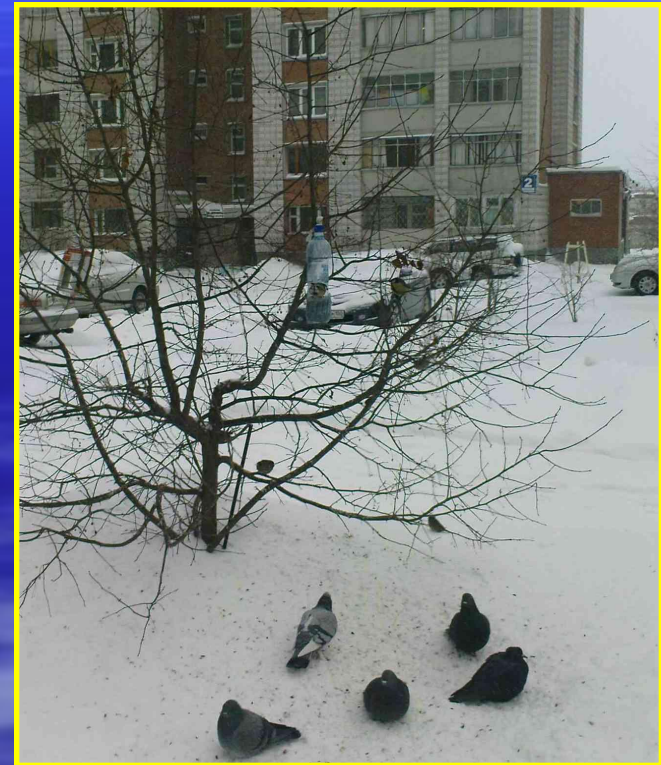
Рис. 22 Кормушка в моем дворе