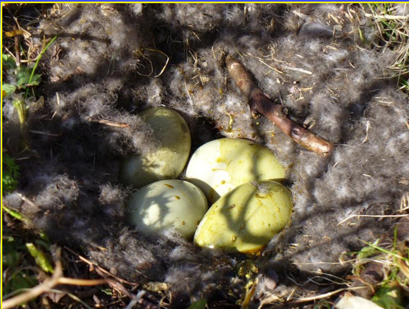
Рис. 11 Гнездо гаги