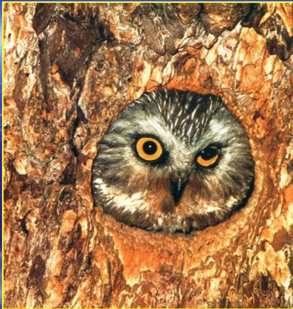
Рис. 9 Сова в дупле