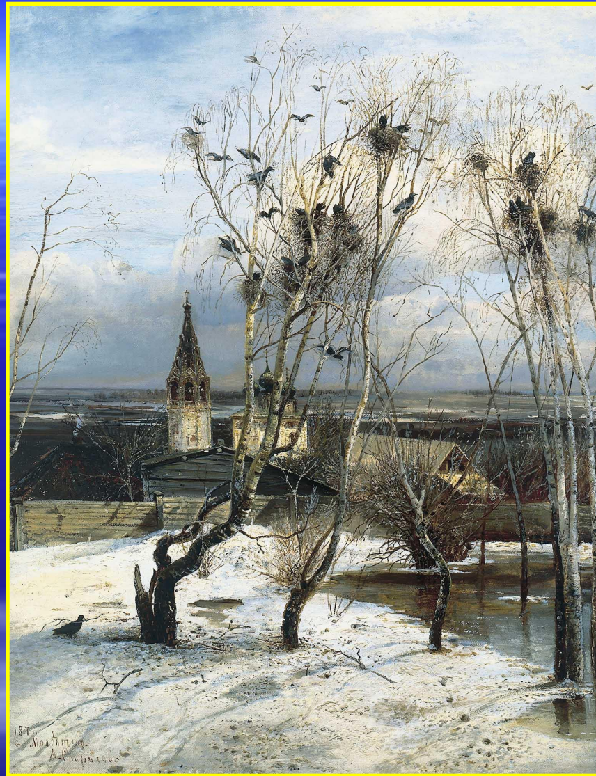
Рис. 1 Грачи прилетели