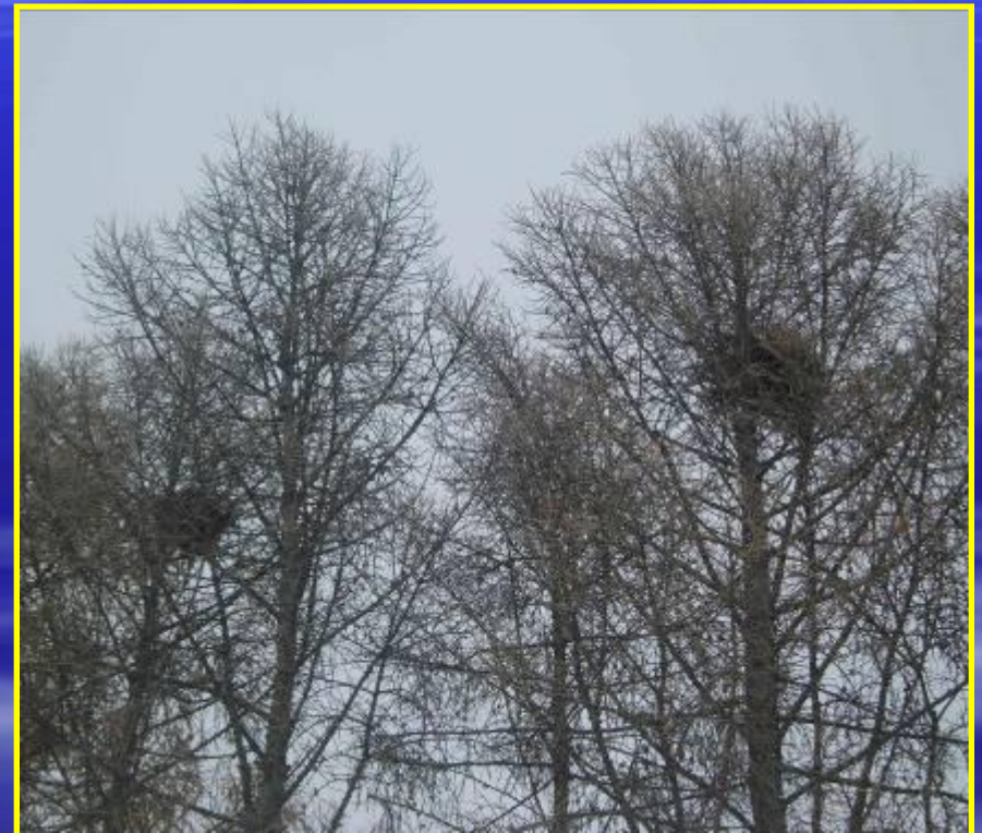
Рис. 13 Гнезда напротив мэрии города Бердска