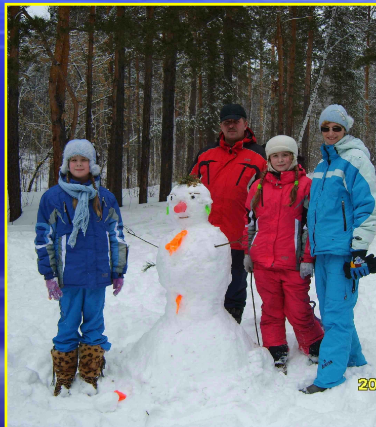
Рис. 20 В лесу с семьей