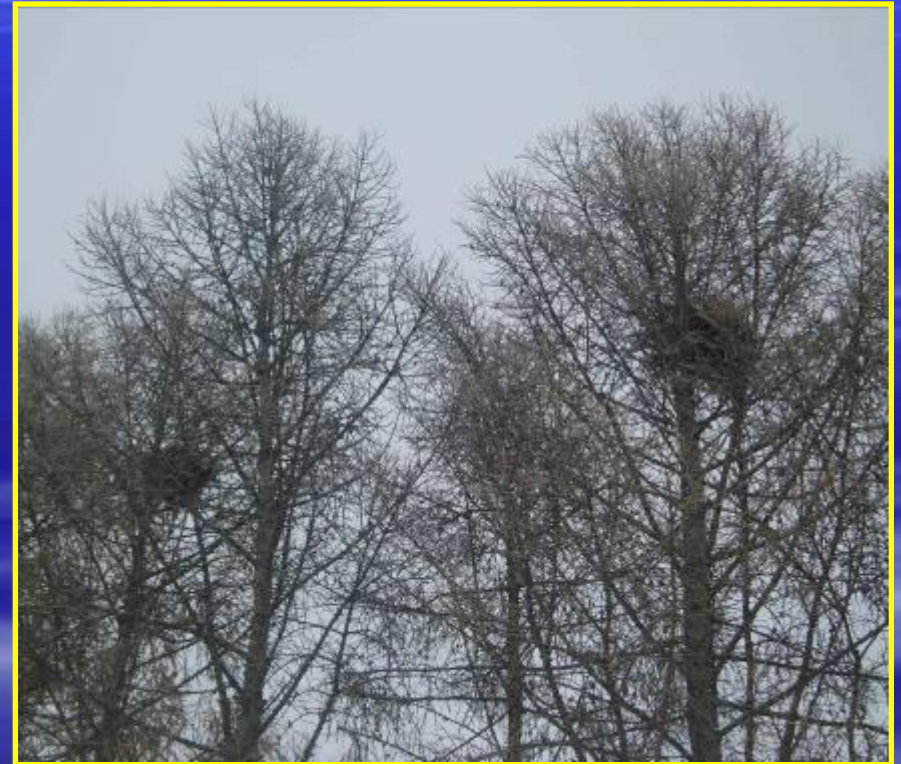
Рис. 13 Гнезда напротив мэрии города Бердска