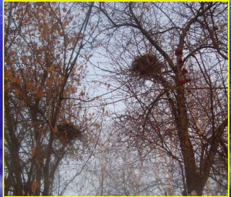
Рис. 15 Гнезда напротив школы № 1