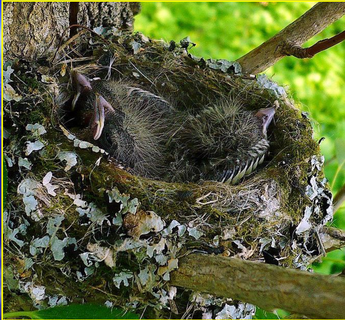
Рис. 4 Гнездо зяблика