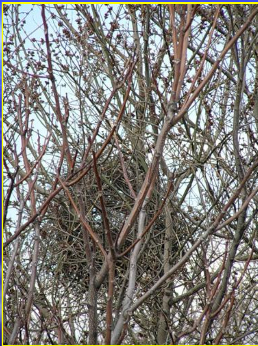
Рис. 2 Гнездо сороки