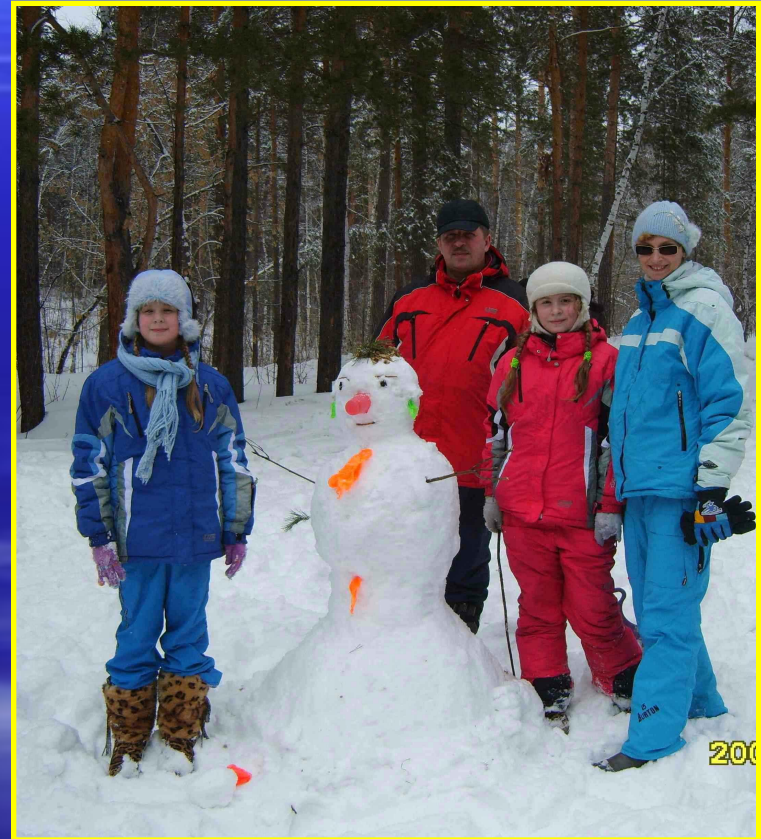
Рис. 20 В лесу с семьей