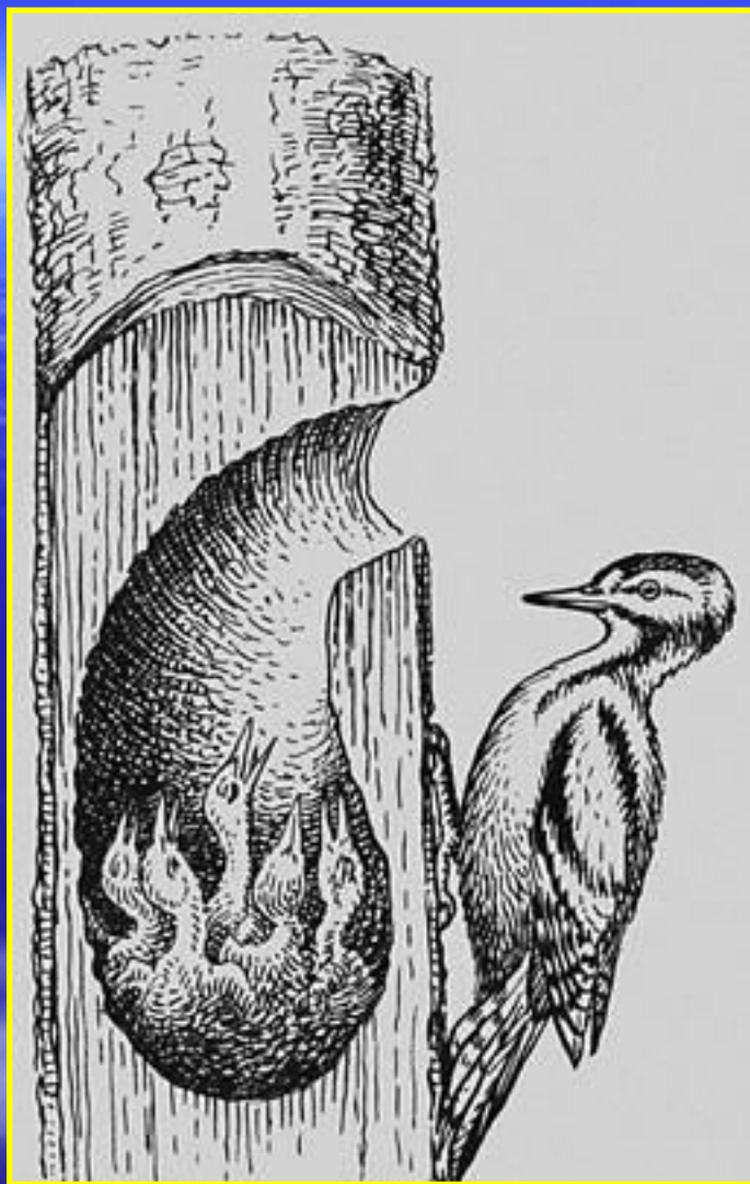
Рис. 7 Гнездо дятла