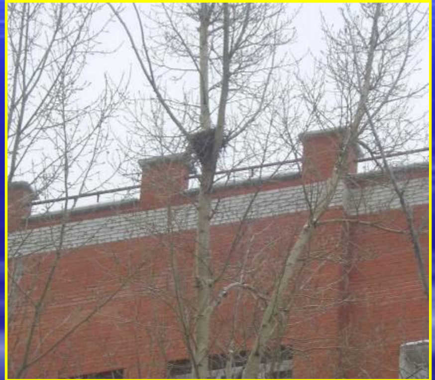
Рис. 14 Гнезда на улице Первомайской