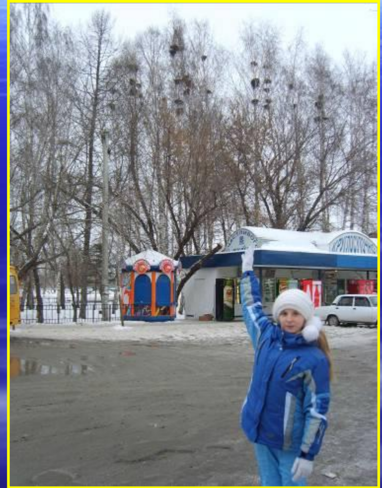
Рис. 17, 18 Гнезда грачей на улице Вокзальной