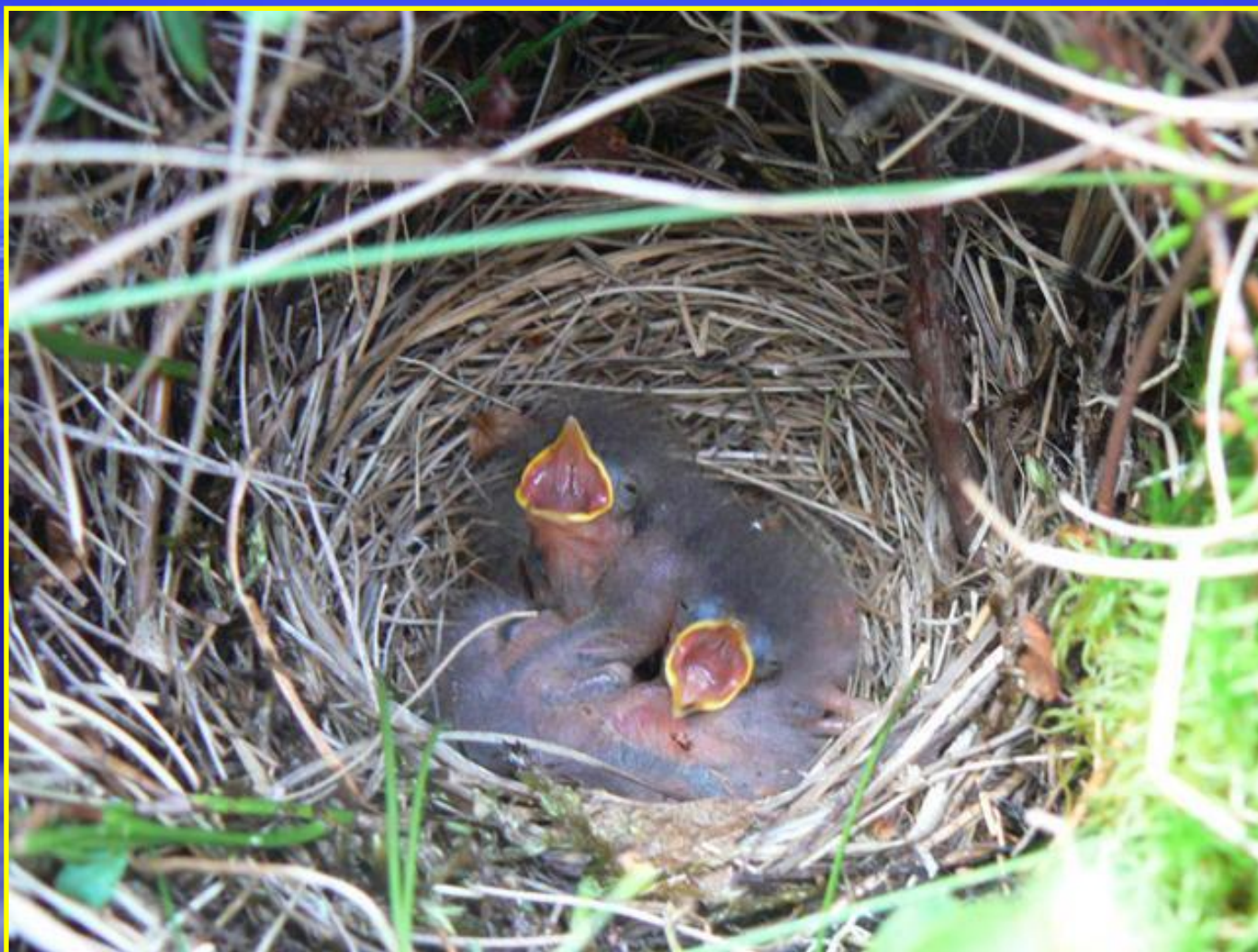
Рис. 3 Гнездо трясогрудки