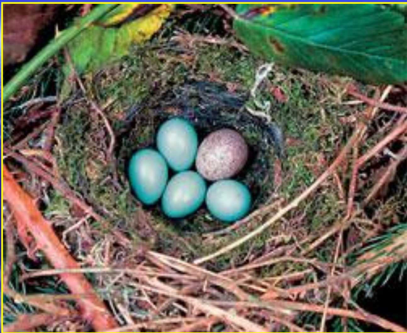
Рис. 12 Яйцо кукушки в чужом гнезде