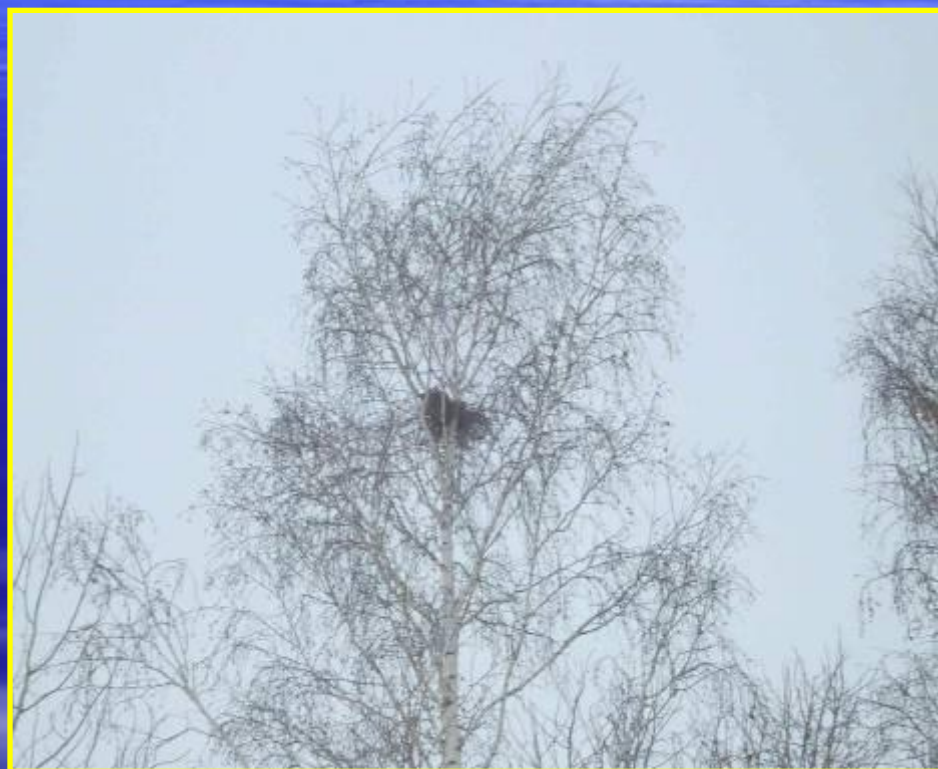
Рис. 16 Гнезда в городском парке