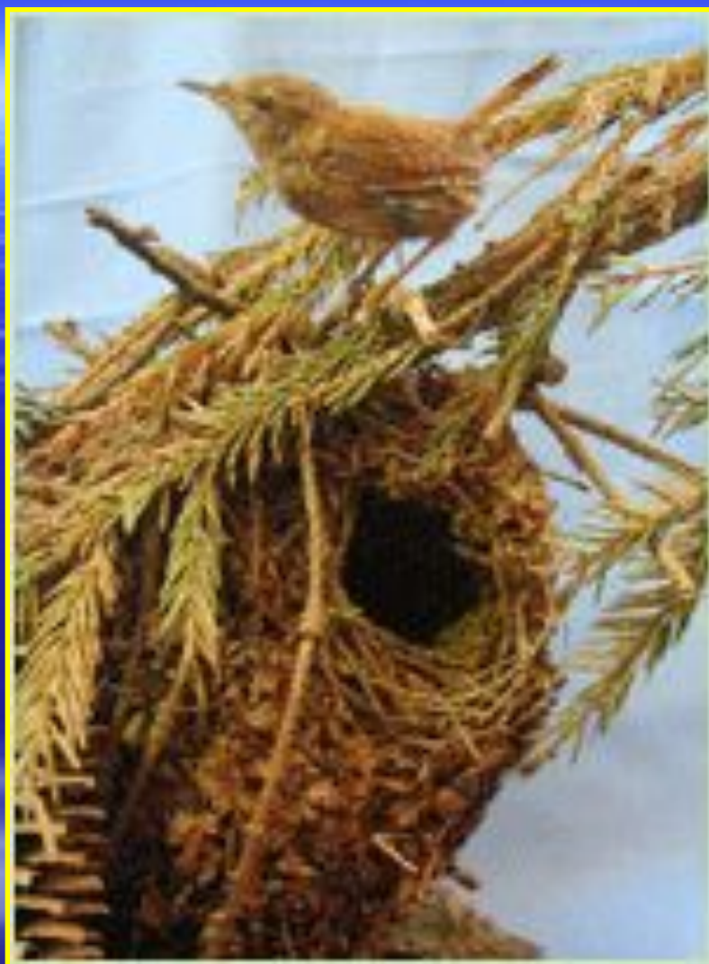
Рис. 5 Гнездо крапивника