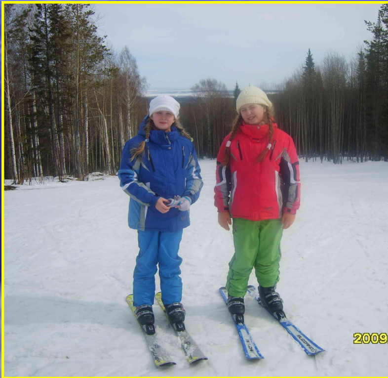
Рис. 21 Катаемся на лыжах и ищем гнезда