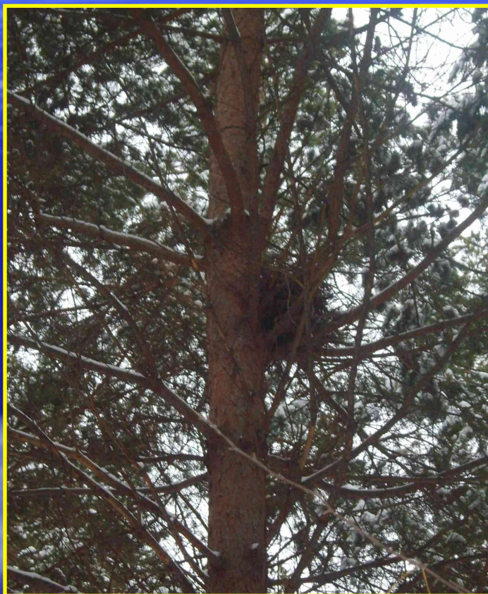
Рис. 19 Гнездо в лесу