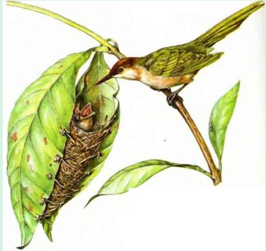
Птица-портниха у гнезда. Пакетик из листьев она сшивает специально подготовленными хлопковыми волокнами. Узелки не дают им развязаться.