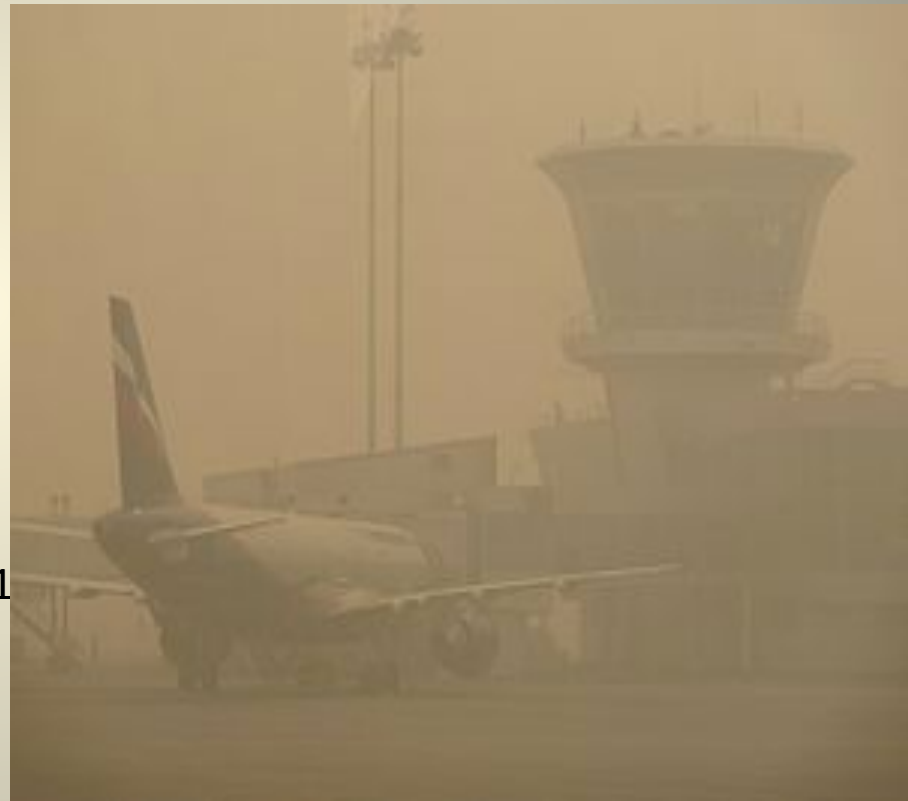
Задымленность аэропорта Шереметьево от лесных пожаров