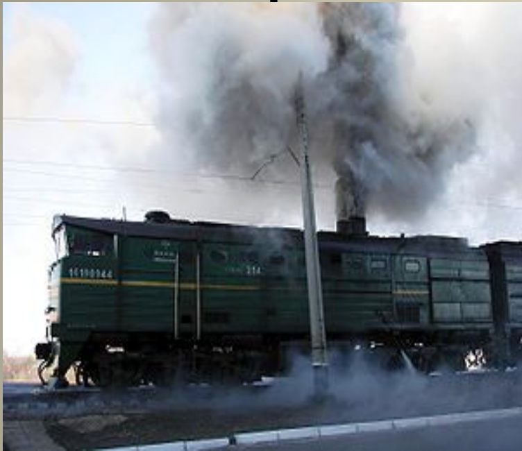
Загрязнение атмосферы тепловозом 2ТЭ1