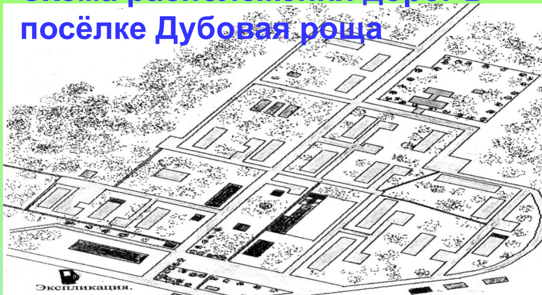
Схема расположения дорог в посёлке Дубовая роща