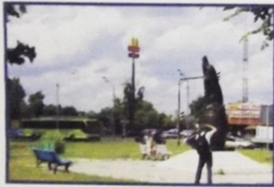
Луховицы. Памятник огурцу