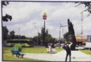
Луховицы. Памятник огурцу