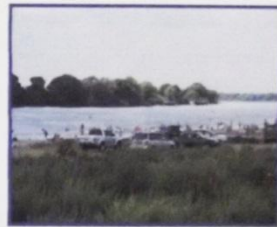
Просторы Оки п. Белоомут