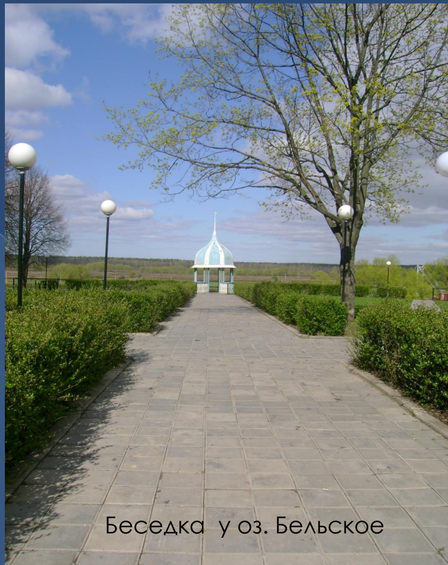
Беседка у оз. Бельское

СОГЛАСНО ЗАКОНУ РФ «ОБ ОХРАНЕ ОКРУЖАЮЩЕЙ ПРИРОДНОЙ СРЕДЫ зелёные зоны городов и населённых пунктов относятся к особо охраняемым природным территориям. Растительность городов улучшает среду жизни человека.