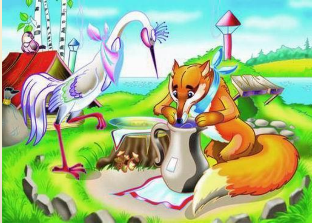
Сказка «Лиса и журавль»

Выявляется разница в строении ротовых аппаратов у разных видов животных, связанная со способами питания. Разнообразие строения животных помогает им приспособиться к различным условиям жизни.