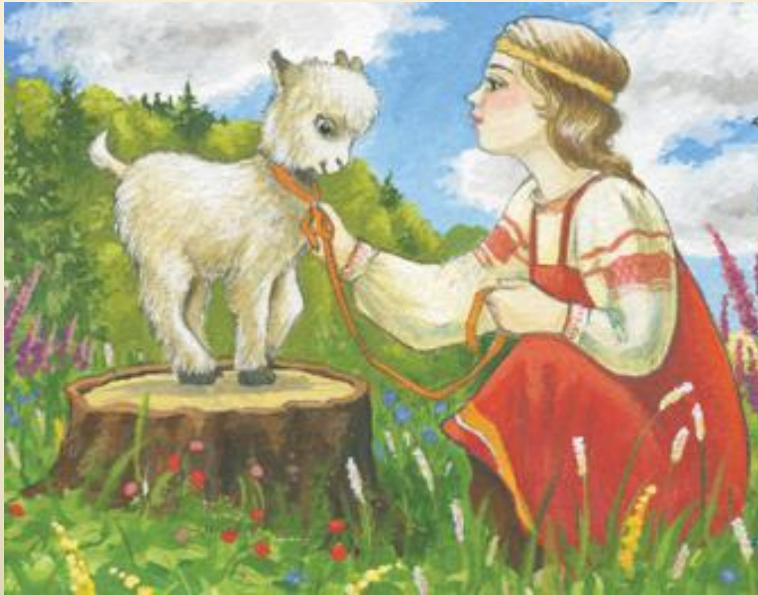
Сказка «Сестрица Алёнушка и братец Иванушка»

Быть может, сочинители этой сказки, пытались предостеречь людей не пить грязную воду, т.к. можно серьёзно заболеть. От животных человек может заразиться различными, в том числе и смертельно опасными инфекционными заболеваниями, одно из путей передачи инфекции через воду.