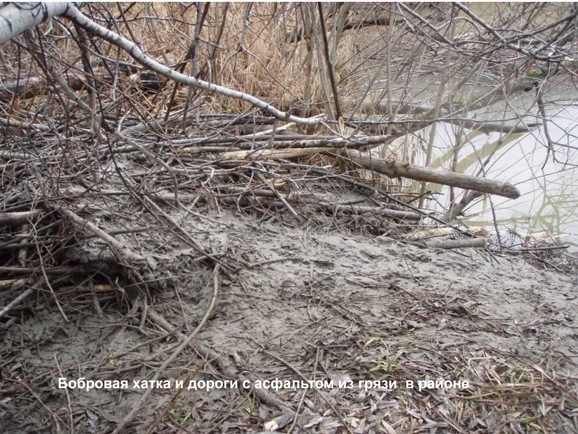
Бобровая хатка и дороги с асфальтом из грязи в районе