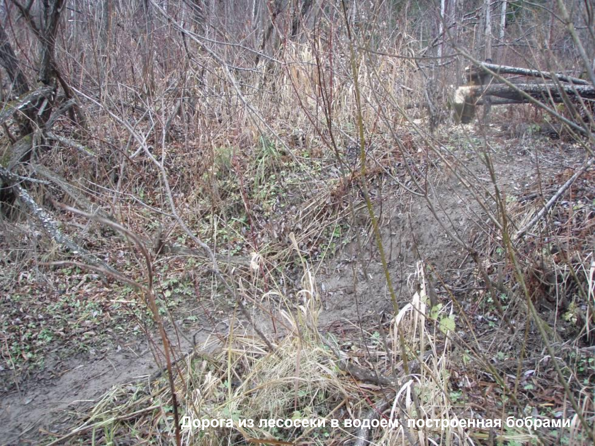
Дорога из лесосеки в водоем, построенная бобрами