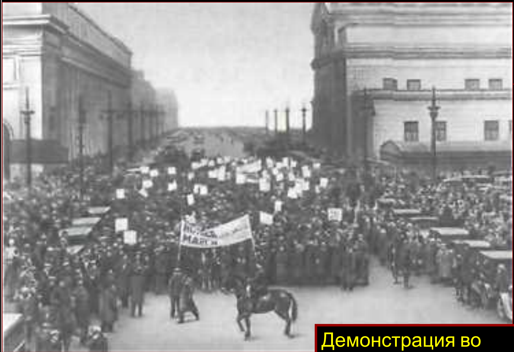
Демонстрация во Франции.