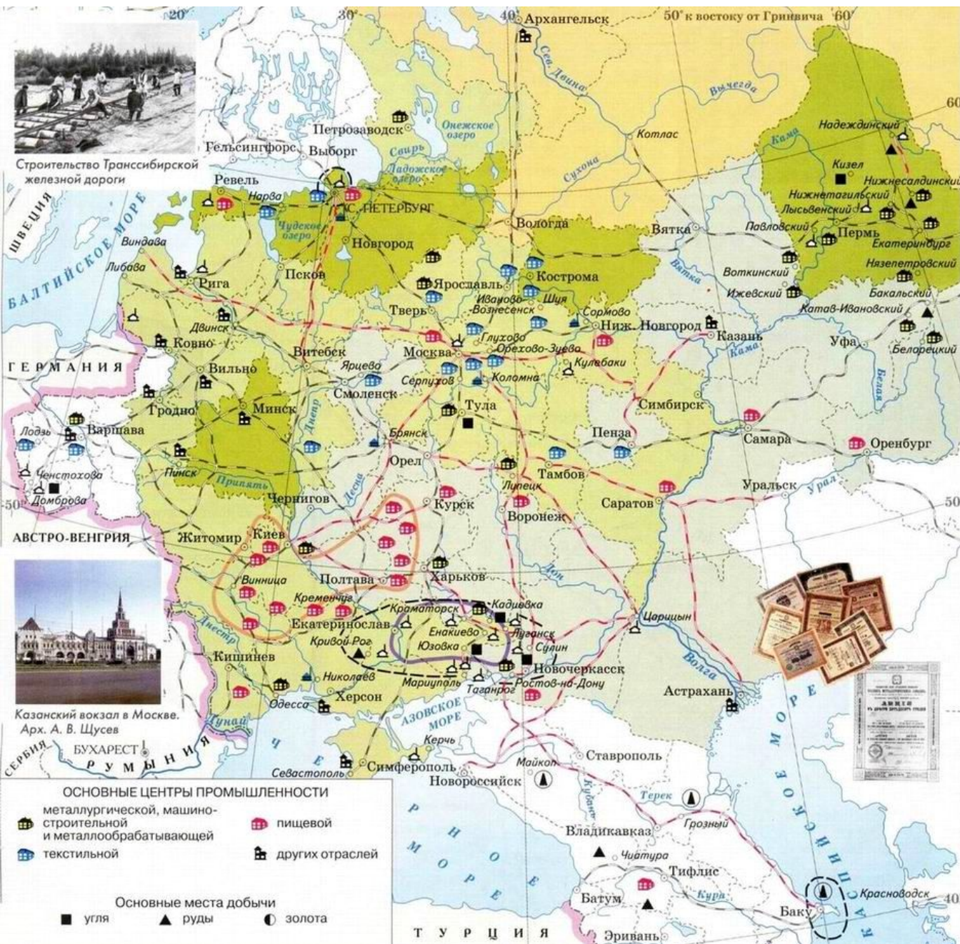
Строительство Транссибирской железной дороги