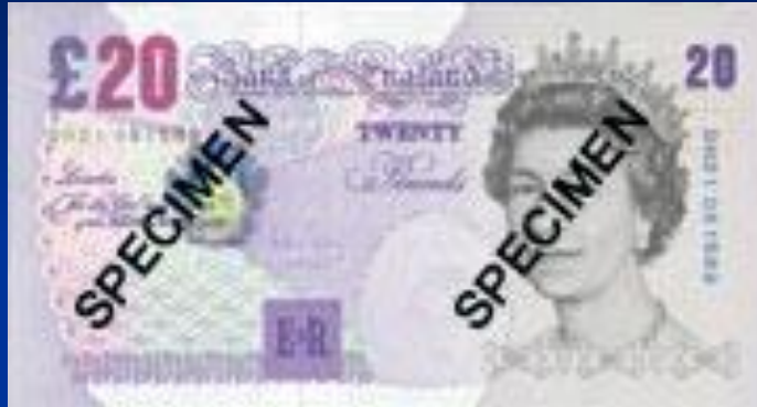
Британский фунт стерлингов