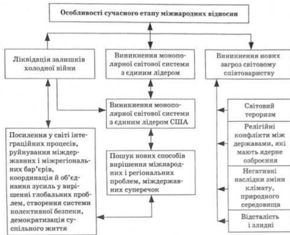
Рис. 15.4. Особливості сучасного етапу міжнародних відносин