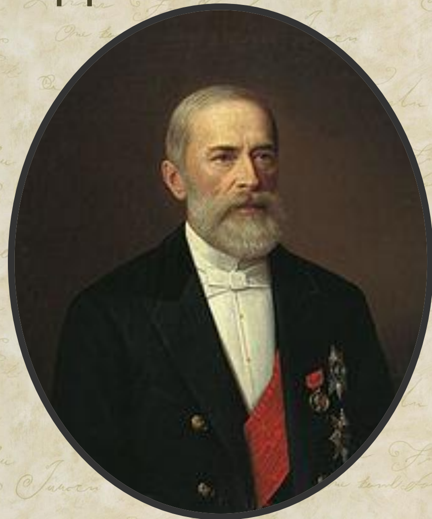
Николай Христианович Бунге