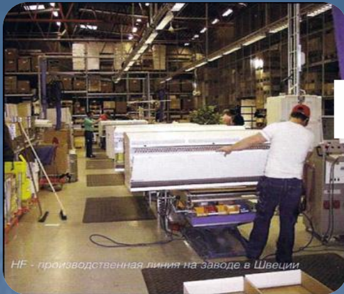
HF - производственная линия на заводе в Швеции

Шведская сталь отличается самым высоким качеством. Машиностроение производит морские суда, легковые и грузовые автомобили, самолеты, ЭВМ, шариковые и роликовые подшипники (1-е место в мире), электробытовые приборы. Получила развитие деревообрабатывающая и целлюлозно-бумажная (ведущее место в мире) промышленность. Имеются предприятия химической, текстильной и пищевой промышленности.