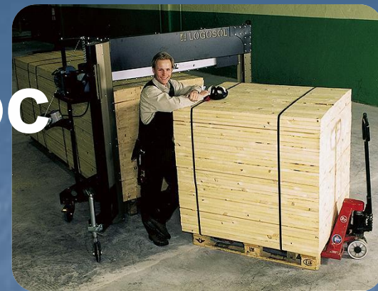
HF - машиностроительная линия на заводе в Швеции