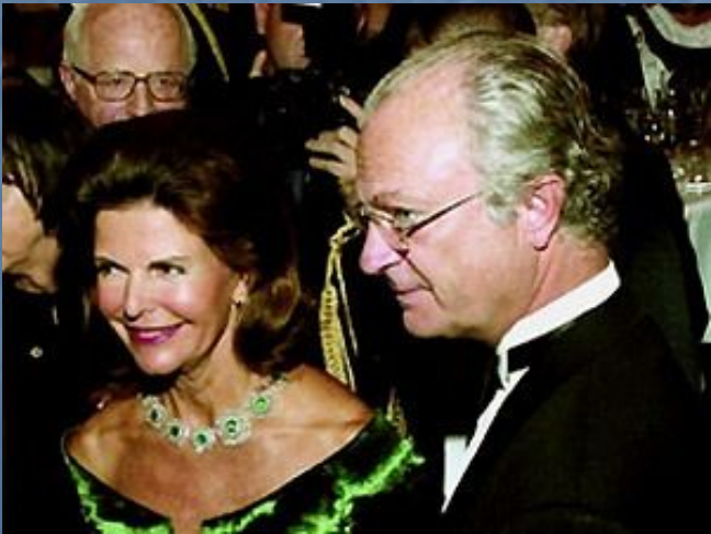
Королева Сильвия и король Карл XVI Густав

Швеция — конституционная монархия. С 1818 у власти находится династия Бернадотов. Действует Конституция от 1975. Глава государства — король, является символом государства и выполняет представительские функции. Законодательная власть осуществляется парламентом (риксдагом), основанным в 1435. С 1971 это однопалатный парламент, состоит из 349 депутатов, избираемых путем всеобщего прямого и тайного голосования раз в 4 года. Партия или коалиция, получившие большинство мест на выборах в риксдаг, формируют правительство во главе с премьер-министром, которому принадлежит исполнительная власть.