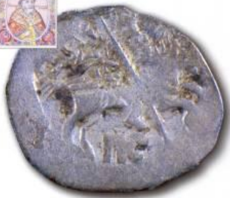
Серебряная гривна, найденная в Таббовской губернии в 1865 г.