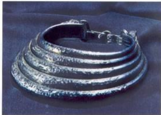
Серебряная гривна, найденная в Таббовской губернии в 1865 г.