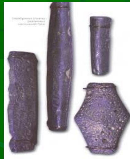
Серебряные гривны, найденные в Таббовской губернии в 1865 г.