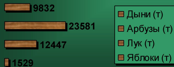
Статистика товарооборота за 2007 год