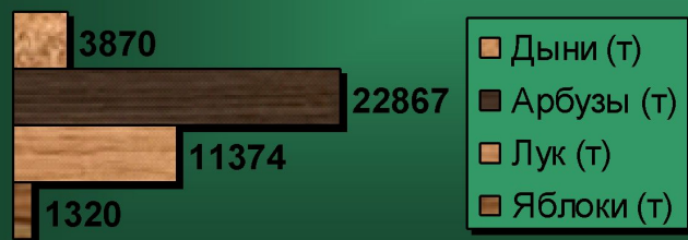
Статистика товарооборота за 1997 год