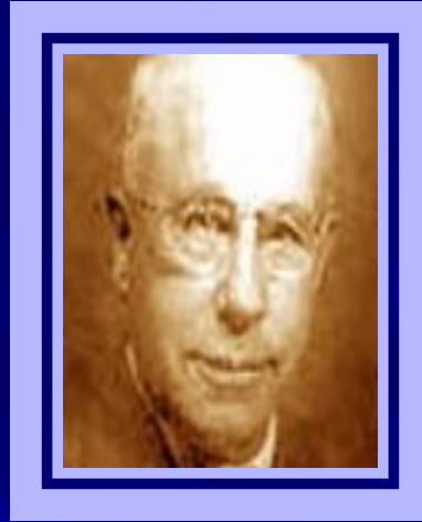
Барнард Честер Ирвинг