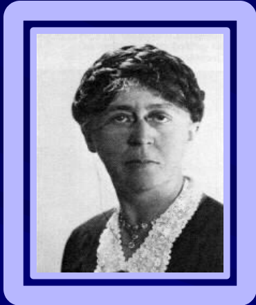
Мэри Паркер Фоллет