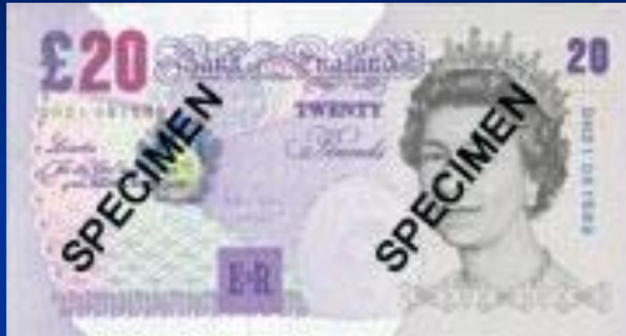
Британский фунт стерлингов