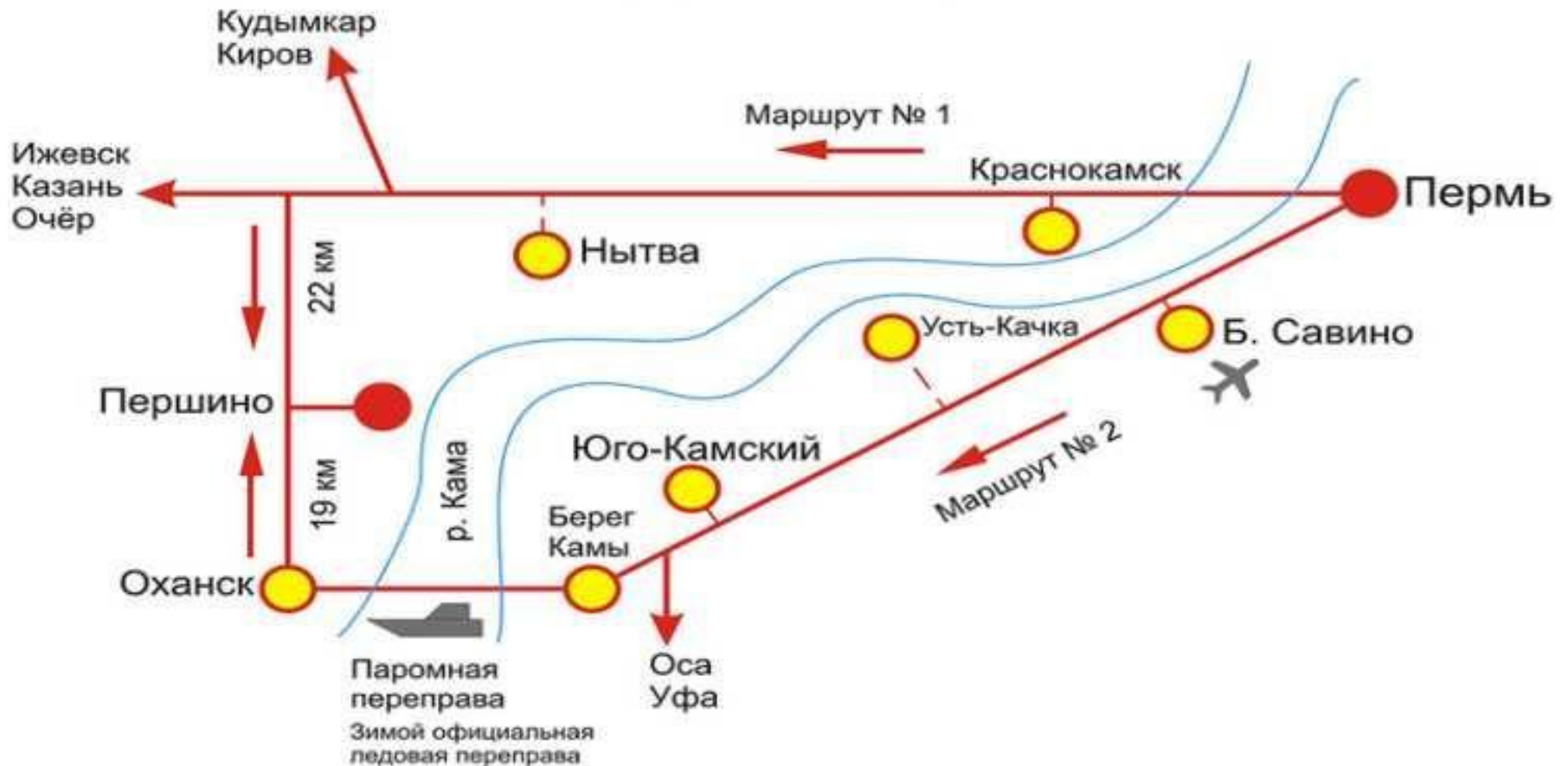
СХЕМА проезда до базы «Першино»