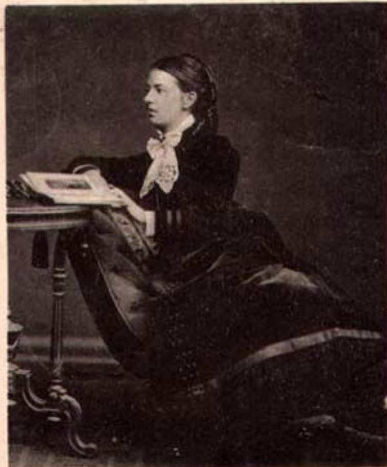
София Васильевна Ковалевская, урожд. Корвинь-Круковская, 1850—1891.

Доктор философии Геттингенского университета, проф. математики Стокгольмского университета.