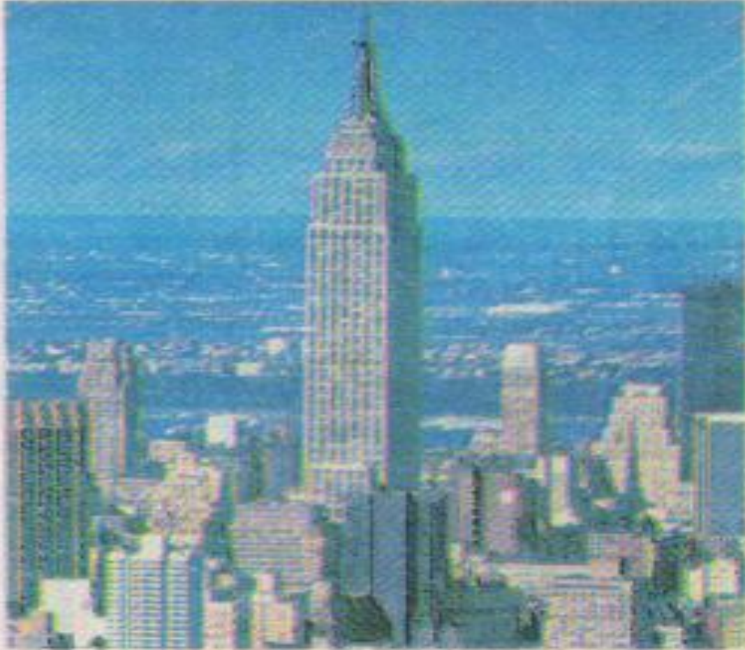
The Empire State Building

It is the most famous building in the world. It's very tall. Here you can visit the Observatory. Visibility on clear day- 80 miles. The Observatory is on the 102 nd floor of the Empire state Building. it's the worlds greatest TV tower. It is 1, 454 feet tall.