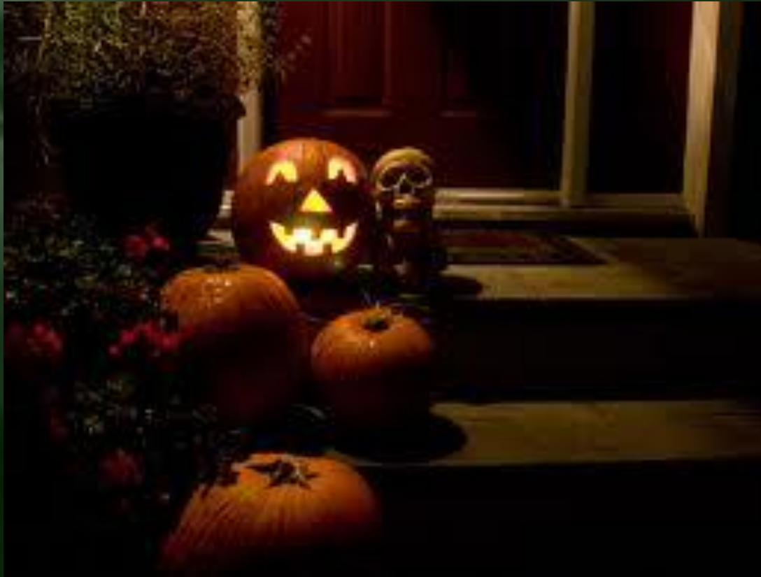
Pumpkins near the house