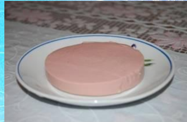
A slice of sausage