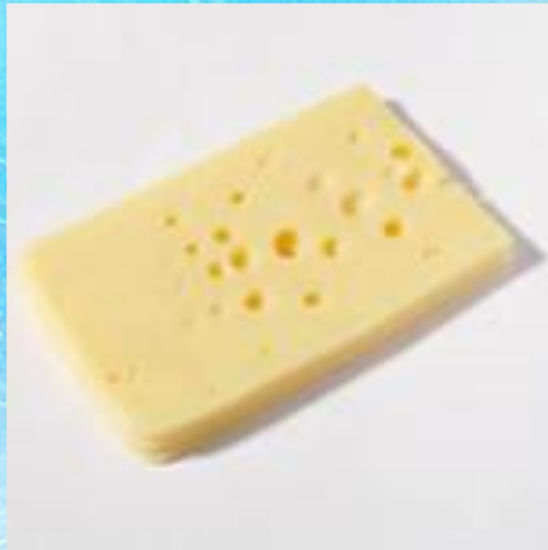
A piece of cheese