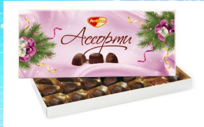
A box of sweets