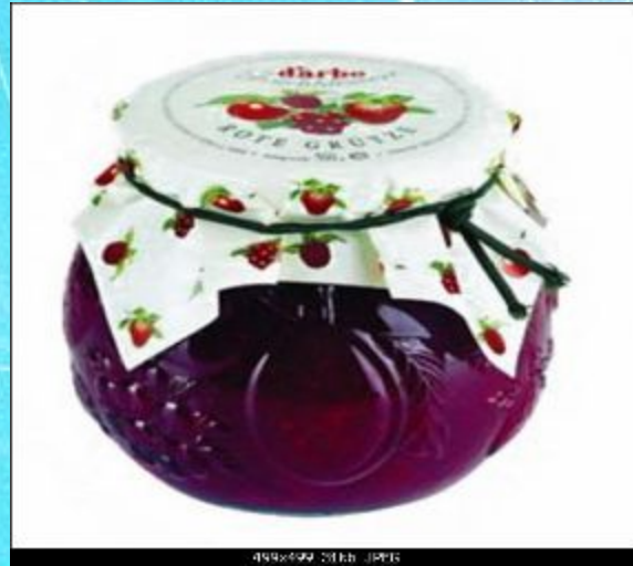
A jar of jam