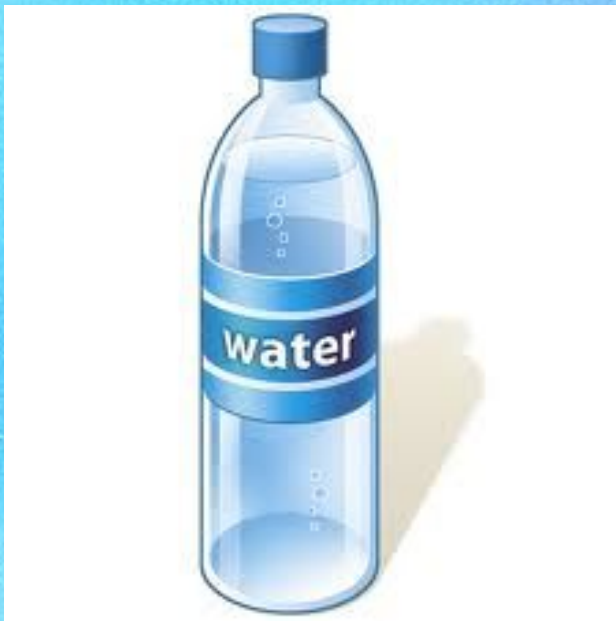
A bottle of water