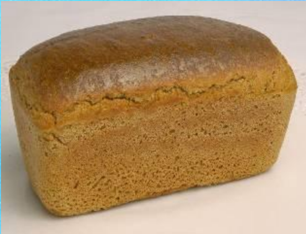
A loaf of bread