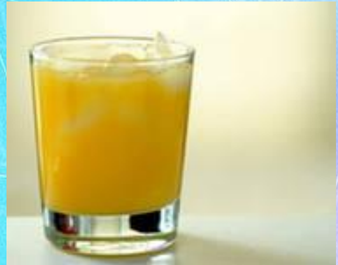
A glass of juice