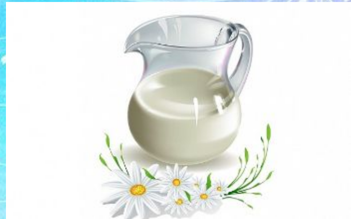
A jug of milk