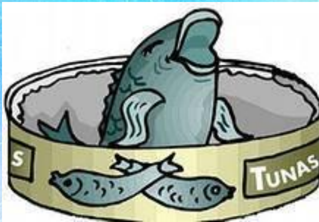
A tin of fish