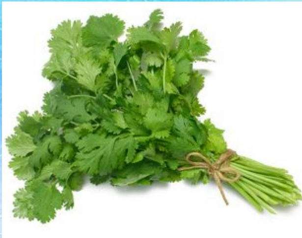
A small bunch of parsley