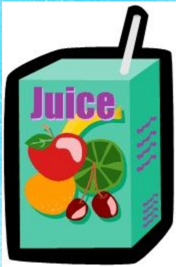
A packet of juice