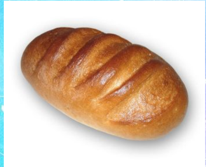
A long loaf of bread