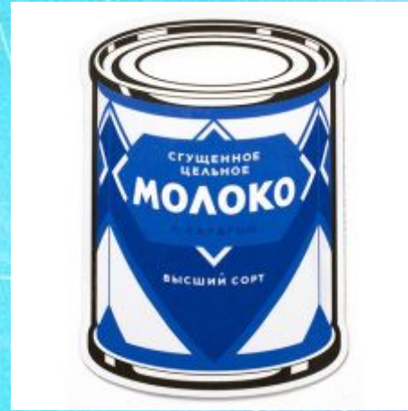
A can of milk