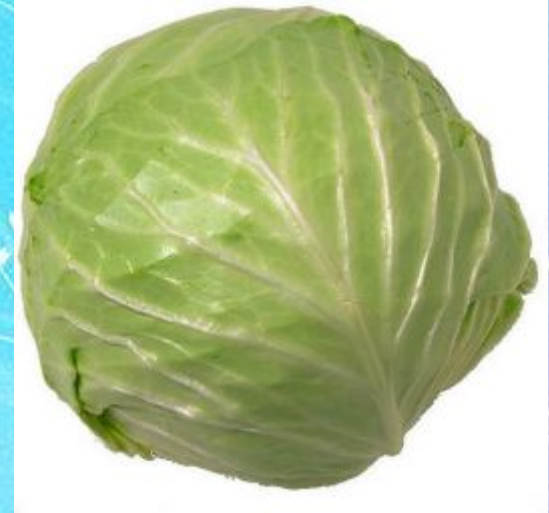
a head of cabbage