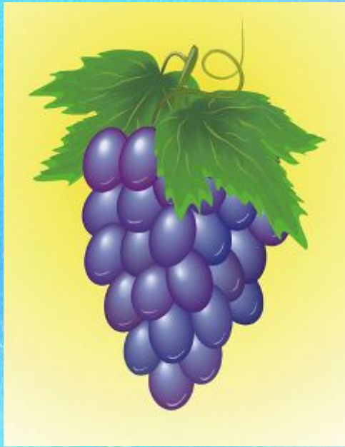
A bunch of grapes