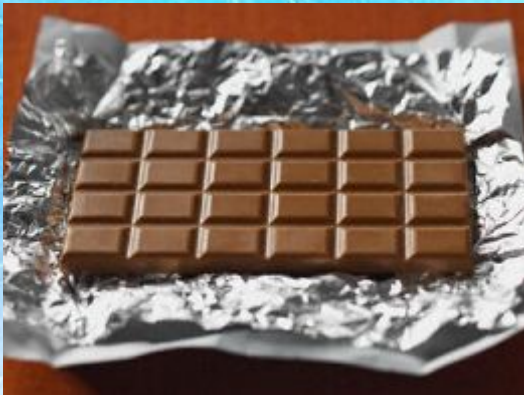
A bar of chocolate