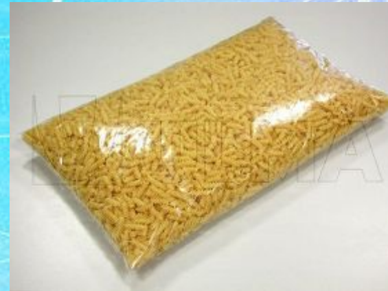
A packet of macaroni