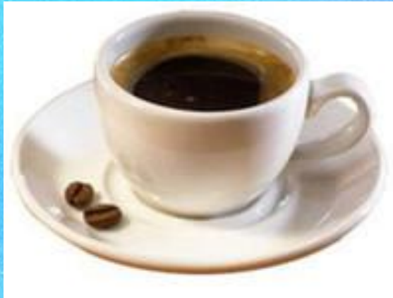
A cup of coffee