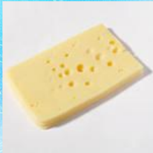
A piece of cheese